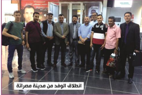
انطلاق الوفد من مدينة مصراتة