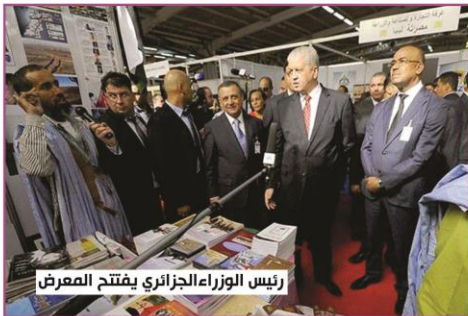
رئيس الوزراء الجزائري يفتتح المعرض