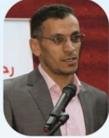
أبو بكر البغدادي