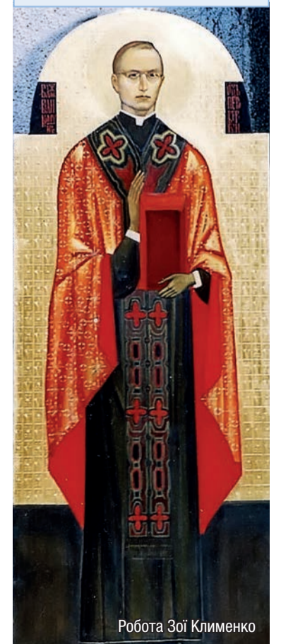
Робота Зої Клименко