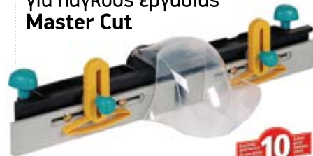
Οδηγός φρεζαρίσματος για πάγκους εργασίας Master Cut