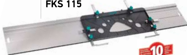
Οδηγός για δισκοπρίονο FKS 115