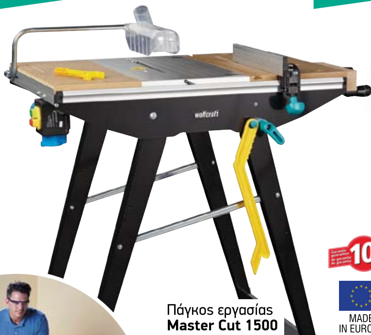
Πάγκος εργασίας Master Cut 1500