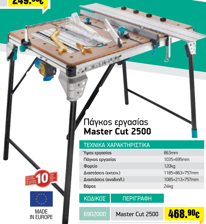
Πάγκος εργασίας Master Cut 2500