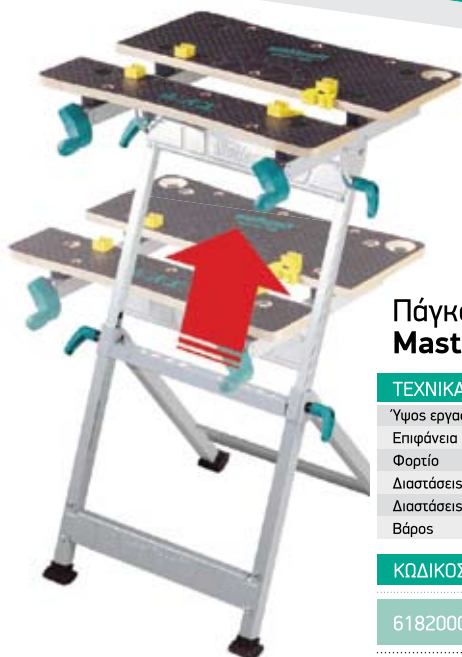
Πάγκος εργασίας Master 600