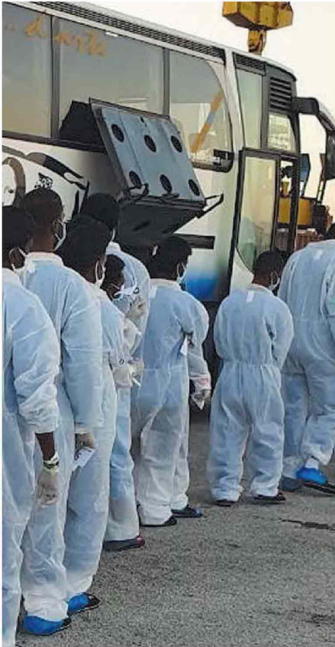
Lo sbarco a Pozzallo dei migranti raccolti dalla Ong Mediterranea nei giorni scorsi. Tra loro nessun infetto: ora si trovano in quarantena