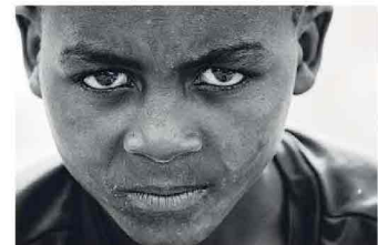
L'EGO - HUB