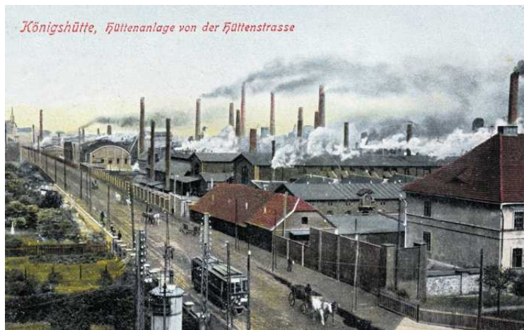
• Królewska Huta, Königshütte (Chorzów), Niemcy, 1903

Mrągowo to niemiecki Sensburg, na starych polskich mapach figurujący jako Żądźbork lub Żądźbork. Także tu obie nazwy nawiązywały do staropruskiego: Sēinits. Trzeba bowiem przyznać, że Krzyżacy na ogół respektowali toponimastykę ziem, które podbili, germanizując je tylko fonetycznie. Także stołeczny dla obecnego regionu Allenstein, czyli Olsztyn, jest nawiązaniem do pruskiego Alne, w wersji niemieckiej Alle, czyli rzeki Łyna. Polska nazwa została więc urobiona fonetycznie