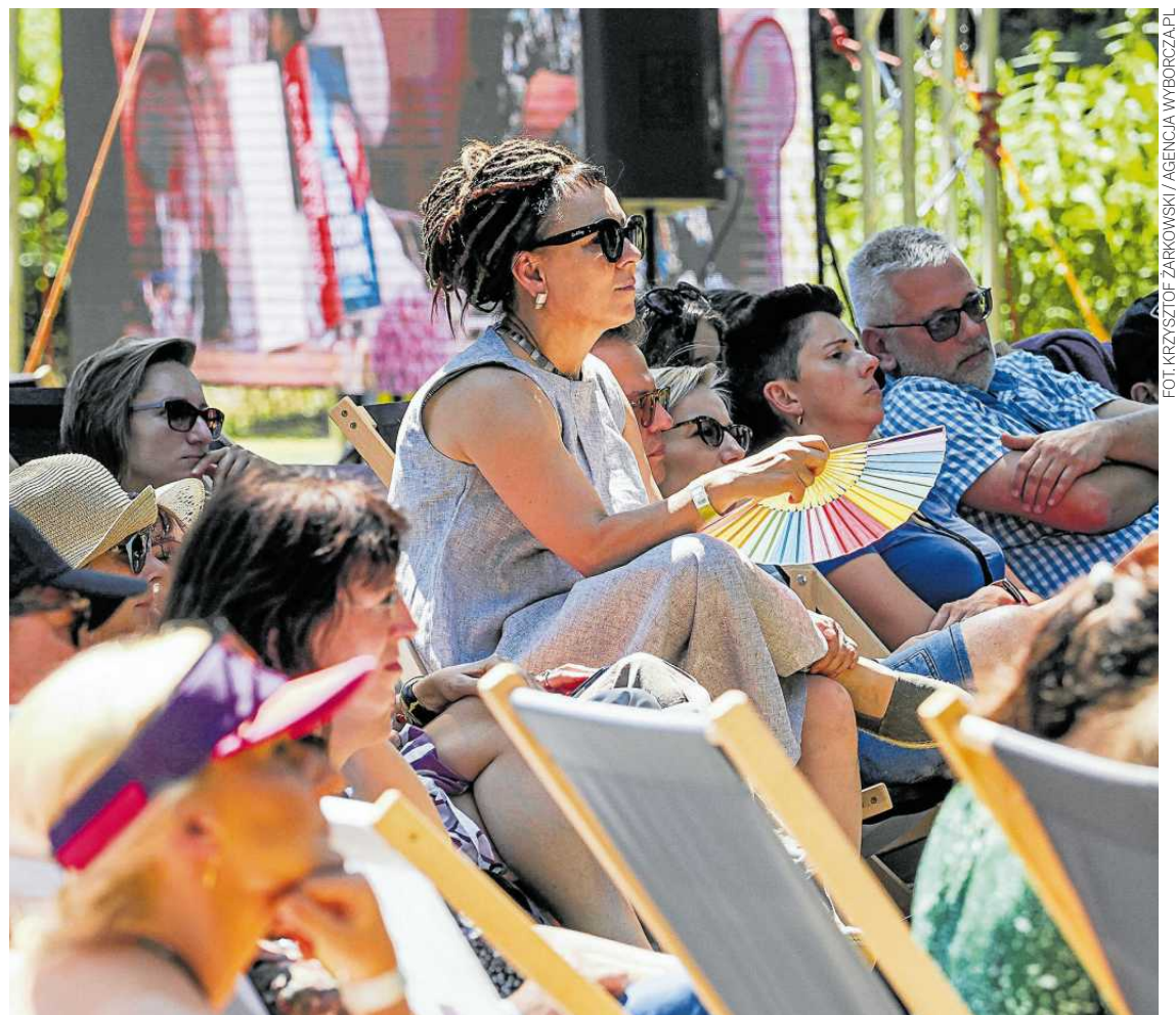
• Olga Tokarczuk na (niedotowanym przez ministerstwo) festiwalu Góry Literatury

Trudno było nie dostrzec braku entuzjazmu obozu władzy, najbardziej widocznego w relacjach TVP z noblowskich uroczystości (a dokładniej ich braku). I choć nie ma obowiązku uwielbienia dla każdej powieści Tokarczuk, nawet lektury tychże, czy zgadzania się ze wszystkim, co powiedziała, jej sukces był radosnym świętem dla milionów Polaków i Polek. I władze powinny to uszanować. Oraz przeciwdziałać kampanii hejtu, która dotknęła noblistkę.