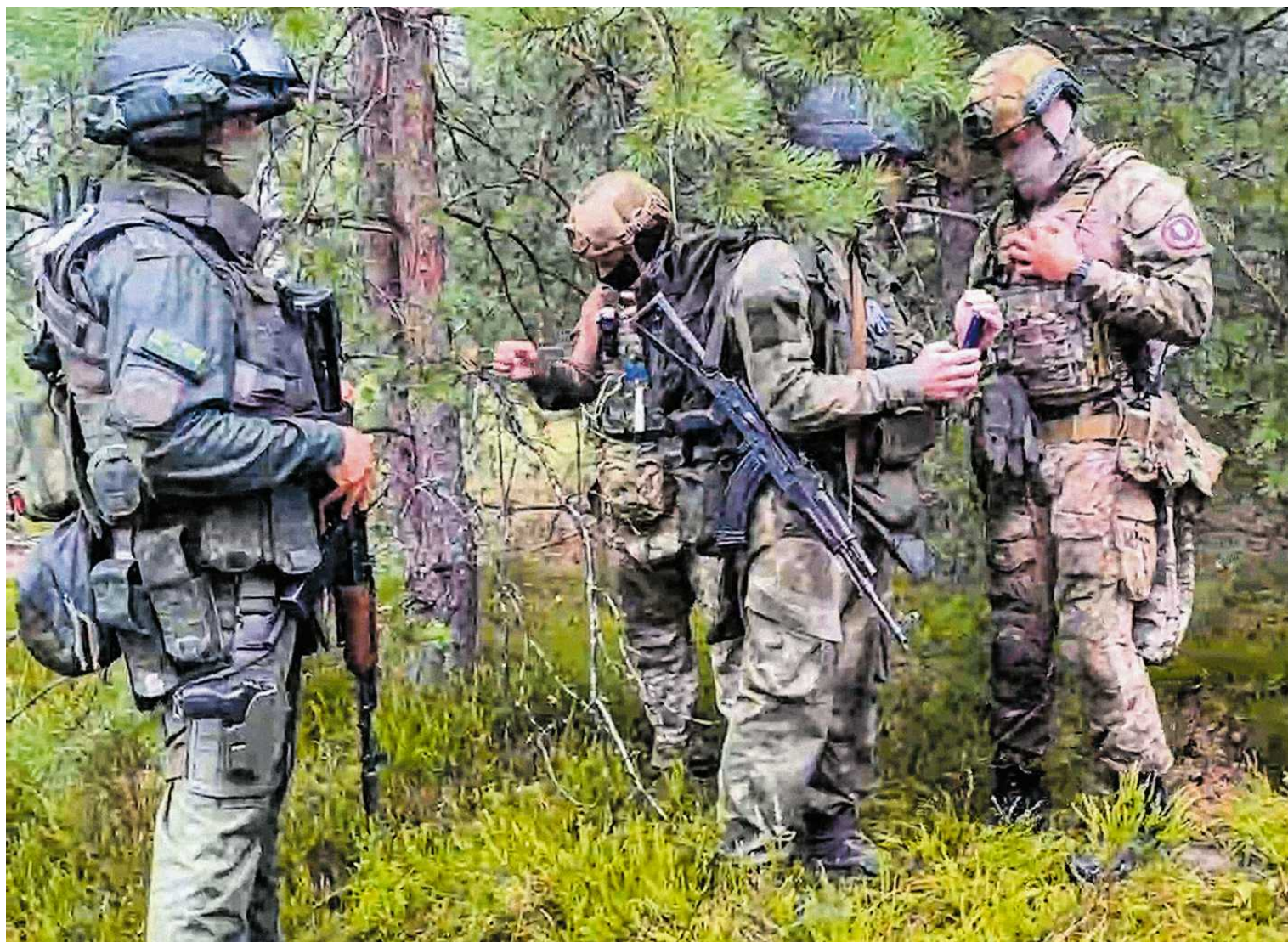
• Żołnierze białoruskich sił specjalnych i wagnerowcy szykują się do wspólnych ćwiczeń w okolicy Brześcia, blisko granicy polsko-białoruskiej. Fragment filmu opublikowanego przez białoruski MON 20 lipca

Oczywiście główną ofiarą rebelii jest sam Prigożyn, choć nie jest to takie proste. Kucharz Putina w ostatnich kilku latach stworzył bandyckie imperium zła, którego Rosja potrzebowała do bezwzględnej walki z Zachodem i wewnętrznym wrogiem, opozycją. Kreml wspierał je ogromnymi