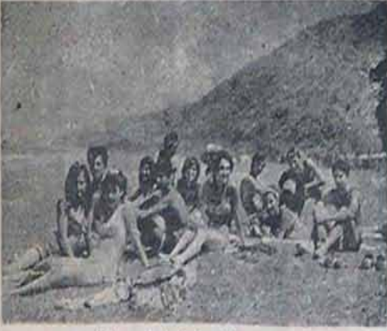
Öğrencilerimizden bir grup deniz kıyısında