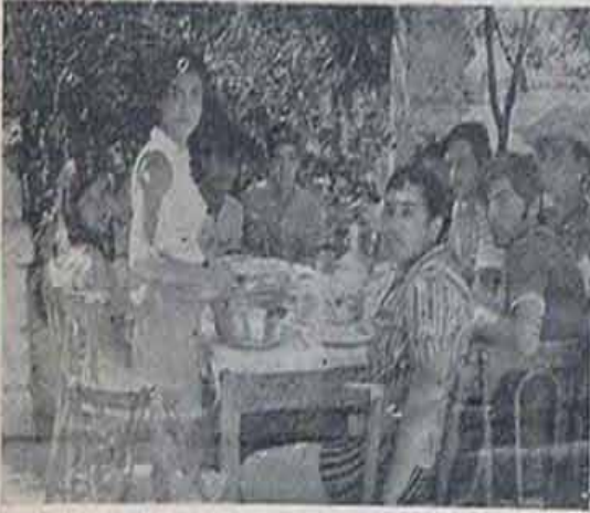
GRAPHO - ENGLISH Abana Kampında Öğle Yemeği