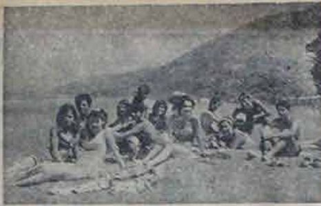
Kamp eğencileri denize