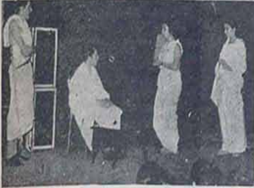
Öğrencilerin Tamamen İngilizce olarak oynadıkları piyesten Bir Sahne