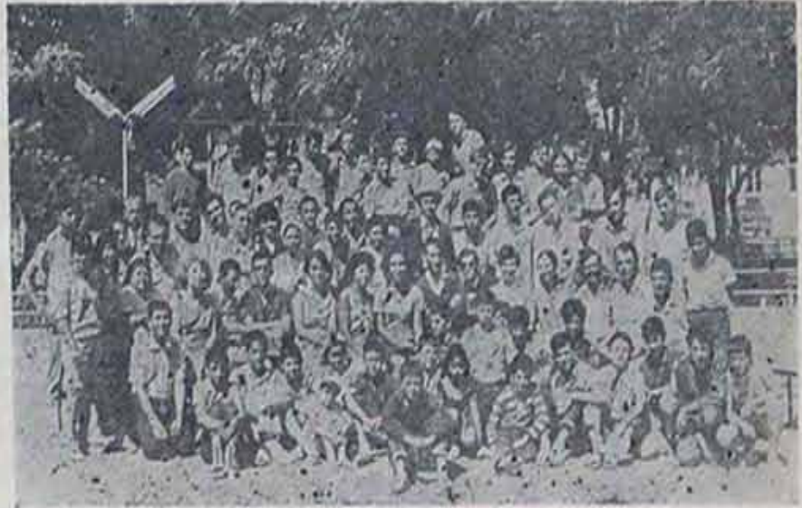
Geçen sene Abana'daki kampımıza katılanlardan bir grup.

İlk gün intibahında hiç bilmiyen, az veya çok bilenler 9 ar kişilik sınıflara ayrılırlar. Her 9 kişiye bir İngiliz öğretmen verilmektedir.