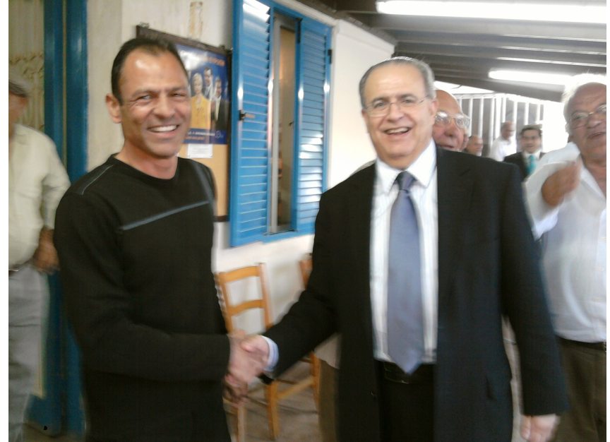
Στη φωτογραφία ο Παμπος Χαραλάμπους Μαύρου, ανταλλάσσει θερμή χειραψία με τον Γ. Κασουλιδη

Εν ριπή οφθαλμού. Πέρασαν από την Χλωρακα τρεις υποψήφιοι Ευρωβουλευτές του ΔΗΣΥ, όλοι μαζί, από τα καφενεία της Χλωρακας. Ήσαν οι Γ. Κασουλιδης, Τ. Ευθυμιου, και Ανδρέας Πιτσιλλιδης. Χαιρετηθηκαν με τον κοσμο, καθησαν λιγο, ειπιαν τον καφε τους, και ανεχωρησαν. Ήταν μια επίσκεψη "εν ριπή οφθαλμού" για να υπενθυμίσουν τους ψηφοφόρους ότι δεν πρέπει να τους ξεχάσουν στις επερχόμενες εκλογές.