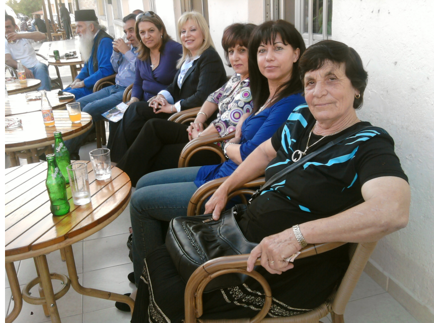
Από την επίσκεψη της υποψηφίας ευρωβουλευτου της ΕΔΕΚ, κ. Κατερίνα Φλουρεντζου Μελισσηνου

κοινότητες, δεν μπορούσε να μην περάσει έστω και για λίγο από την Χλώρακα και να δει, και να χαιρετίσει τον κόσμο αφού αισθάνεται και νιώθει σαν χωριανός. Με όλους τους χωριανούς τον δένουν δεσμοί φιλικοί και άλλοι, και την αγάπη που του δείχνουν όλοι οι κάτοικοι, θέλει και αυτός να την ανταποδώσει. Έτσι επ ευκαιρία ειλημμένων υποχρεώσεων του στην Επαρχία της Πάφου, πέρασε και από την Χλώρακα έστω και για λίγο, έστω και για ένα για.