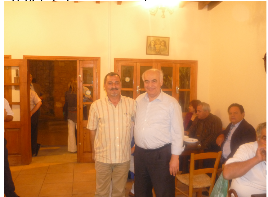
Το ΕΥΡΩΚΟ στα καφενεια της Χλωρακας