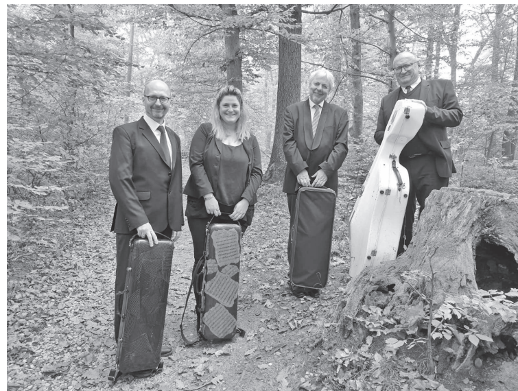
Gudački kvartet Sebastian

Capriccio Felixa Mendelssohna Bartholdyja sastoji se od polaganog uvoda sjetnog i bolnog karaktera i majstorski pisane fuge, koja virtuozno tretira sve četiri dionice te svečano i snažno zaključuje skladbu. Anđelko Igrec je skladbu Ecce lignum napisao 2011. za Kvartet Sebastian, koji ju je i prouzveo iste godine na Pasijskoj baštini. Skladba se temelji na motivu gregorijanskog korala Evo drvo križa . Različitim skladateljskim postupcima i načinima sviranja Igrec nastoji dočarati bogatstvo poruke teksta korala. Sviranje con legno (drvetom, štapom gudača) zvučno dočarava drvo, udaranje prstima po tijelu glazbala dočarava udarce, sviranje dugih glissanda – fijuk vjetra, sviranje sul ponticello i sviranje iza konjića stvara opori zvuk, koji priziva patnju... Skladba počinje u tišini, doseže vrhunac u krik, nakon kojeg slijedi smiraj i nestajanje u tišini. Svoj jedini gudački kvartet Eduard Lalo je napisao 1855. kada je imao 22 godine. Nije bio do kraja zadovoljan skladbom, pa ju je 29 godina kasnije preradio. Rezultat je sinteza mladenačkog ushita i nadahnuća s iskustvom zrelog majstora.