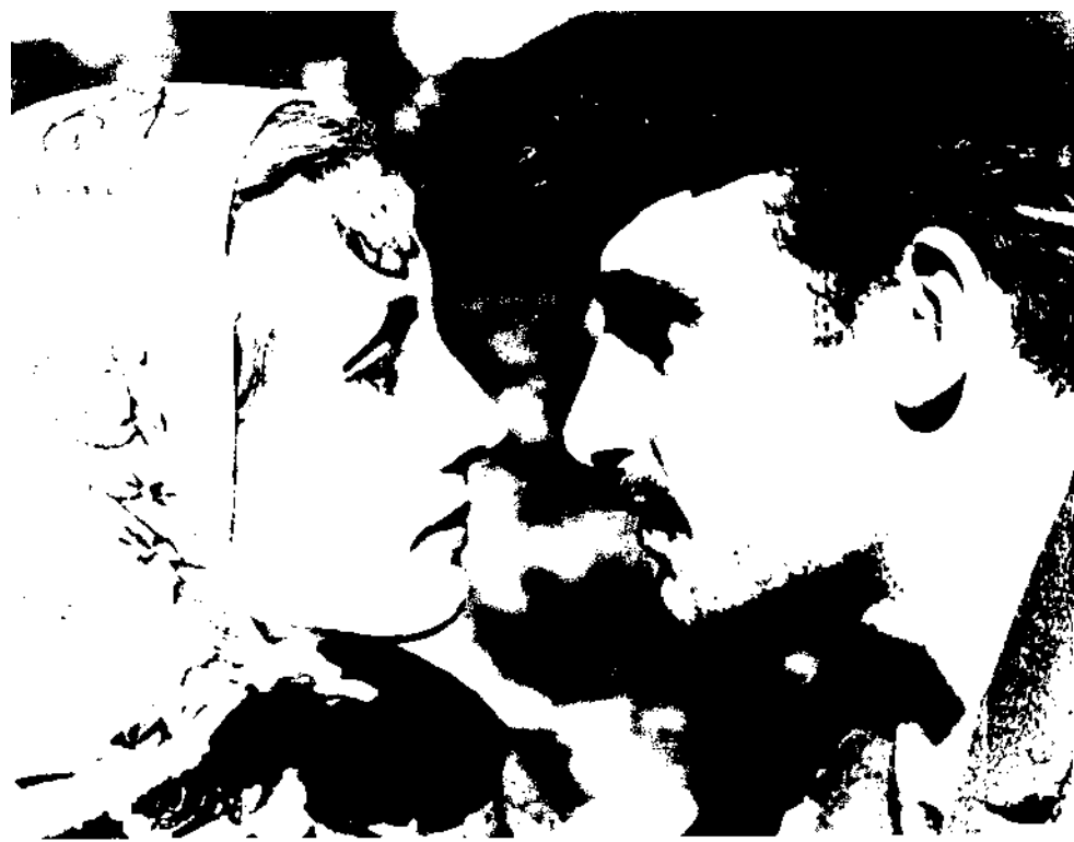
Cahide Sonku: üne kavuştuğu Bataklı Damın Kızı Aysel de Talat Artemel'le.

yakından tanıyan aktör İsmet Ay'a göre ise " İlahe bir vucut, sarışın bir baş "tı.