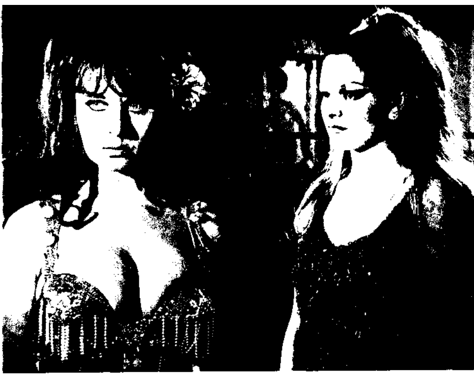
Fatma Girik: Avare Kız 'in bir sahnesinde Ajda Pekkan 'la.