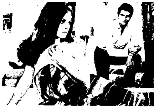
Hülya Koçyiğit: Funda'da Salih Güney'le.