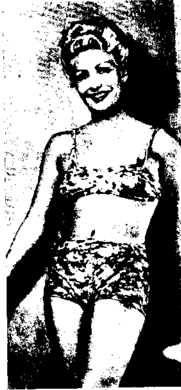
Cahide Sonku; Şehvet Kurbanı'nda Muhsin Ertuğrul'la belleklerden silinmeyecek bir başarıya ulaşmıştı