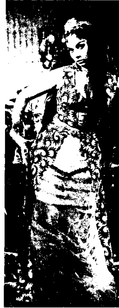
Belgin Doruk; Binnaz'da...