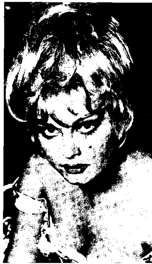
Türkan Şoray: sinemaya atıldığı ilk yıllarda.

naklanıyordu. Özellikle de Türkan Şoray'ın başta sözünü ettiğimiz dünya "Ayakların baş olduğu" bu dönem, belli bir süre için gerçek yıldızlardan Türkan Şoray'ın, Hülya Koçyiğit'in ve Fatma Girik'in "çöküş"ünü de hızlandırdı. Çünkü, televizyonun yaygın etkisine başkaldırmak zorunda kalan bu tür sinemanın egemen duruma geçmesi, biraz da bu yıldızların tutum ve davranışlarından kay-