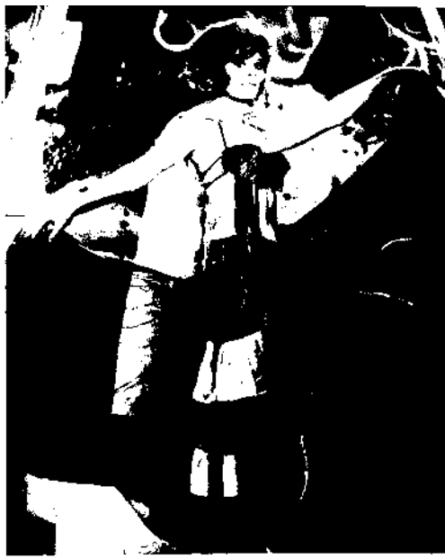
Hülya Koçyiğit: O Kadın'da.