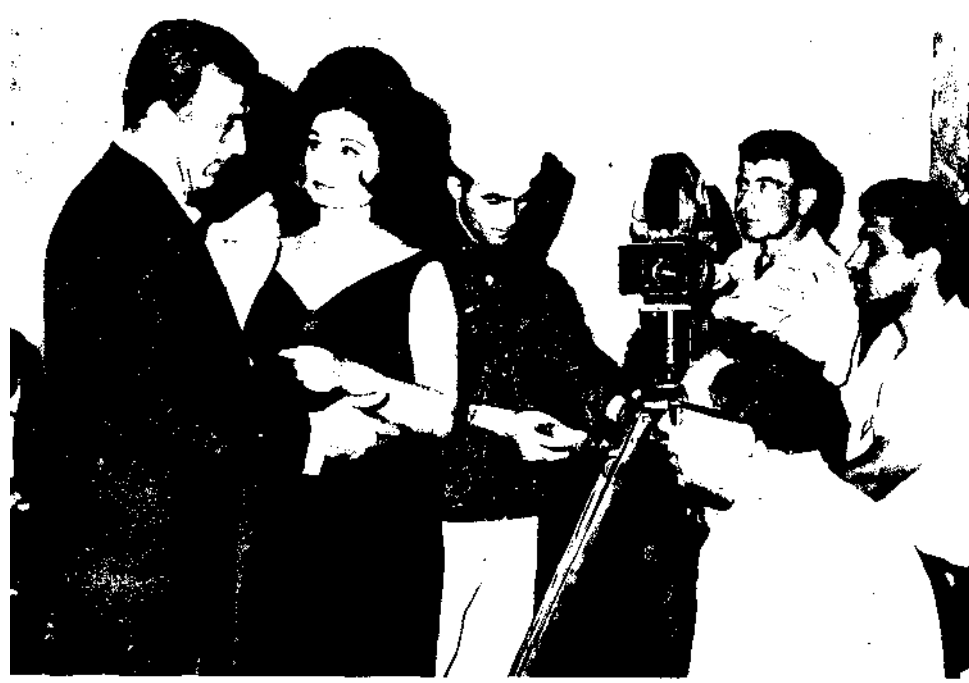
Küçük Hanımefendi Filminin setinde yönetmen Nejat Saydam ve aktör Sadri Alışık'la.