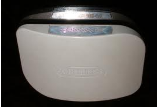
fig.2 Neutralizator GAMMA –7; 500 EURO

aparator, asigura o buna functionare a partii electrice a autoturismelor.