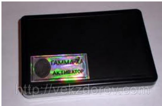
fig.3 ACTIVATOR GAMMA -7; 700 EURO