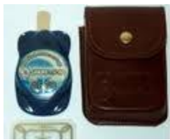
fig.5 NEUTRALIZATOR PENTRU AUTOMOBIL GAMMA – 7-AC, 500 EURO;

elimina stresul in timpul conducerii automobilului, protejaza de zonele patogene, elimina oboseala, refacere rapida dupa effort fizic si psihic, reface sistemul