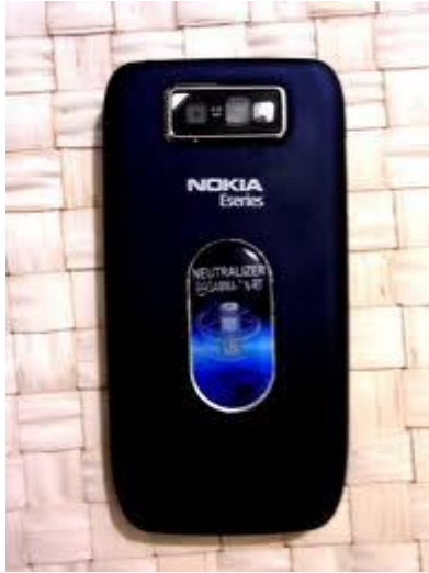
fig.4 NEUTRALIZATOR PENTRU MOBIL GAMMA – 7 RT = 100 EURO