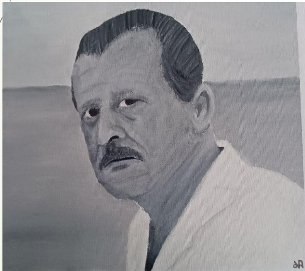
Ζωγραφική από την Παρασκευοπούλου Ιωάννα, Β' Τάξης