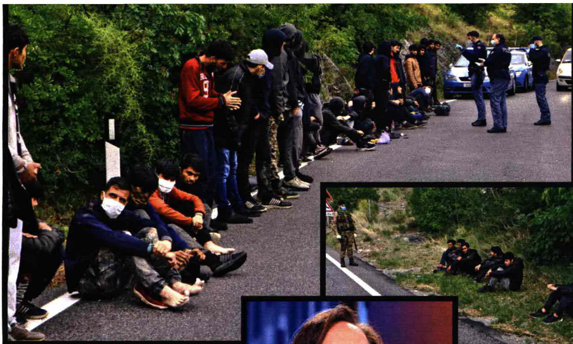
Gruppi di migranti bloccati da polizia e militari alle porte di Trieste. Sotto, Luciana Lamorgese, ministra degli Interni.