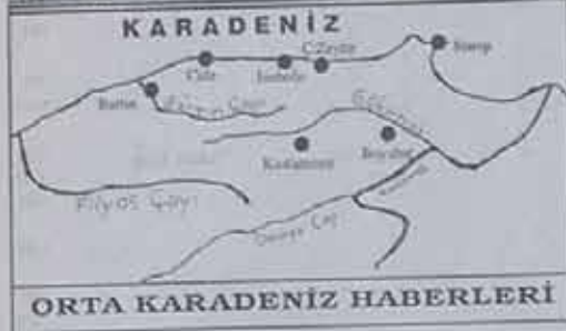
ORTA KARADENİZ HABERLERİ