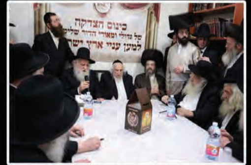
רבינו מרן זצוק"ל מכנס את גדולי התורה בביתו באחד באדר ה'תשע"ז לפתוח את המגבית השנתית