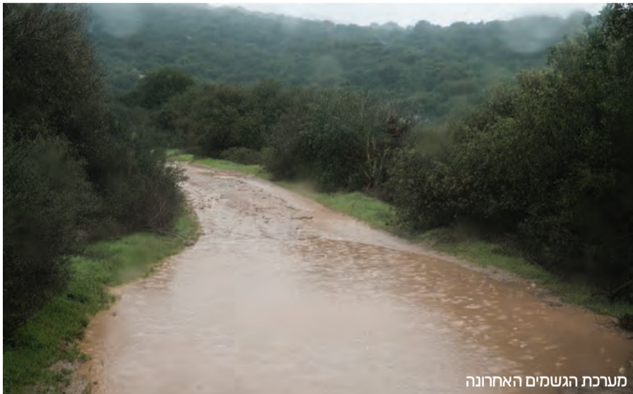
מערכת הגשמים האחרונה

ייפסק הגשם בהדרגה, תחילה קיים אף חשש קל לשיטפון נות בנחלי הדרום והמזרח. בשעות אחר הצהריים צפויה הפוגה בגשמים והטמפרטורות תהיינה נוחות. עם זאת, בשעות הלילה צפוי הגשם להתחזק בצפון ובמרכז. מחר צפויים אי"ה גשמים לפרקים בצפון הארץ ובמרכז. תחול ירידה בטמפרטורה רות. לקראת שעות הצהריים