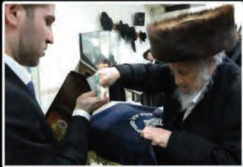
בליל פורים דמוקפין ה'תשע"ז, לאחר קריאת המגילה בהיכל הישיבה הקד', העביר רבנו מרן זצוק"ל את תרומתו למען עניי ארה"ק