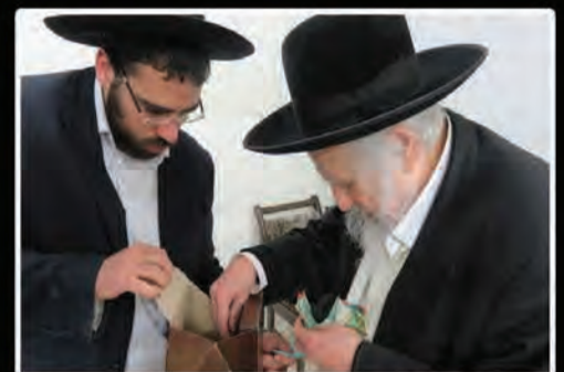
ביום תענית אסתר ה'תשע"ז רבנו מרן זצוק"ל העביר למען עניי ארה"ק את תרומתו זכר למחצית השקל