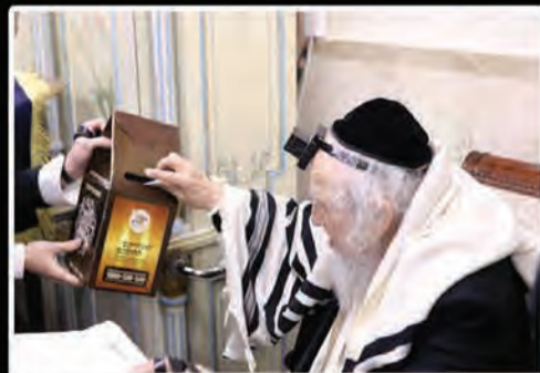
בעיצומו של יום הפורים ה'תשע"ז, מיד לאחר קריאת המגילה בהיכל הישיבה, העביר רבנו מרן זצוק"ל את כספי ה"מתנות לאביונים" ע"י "חסדי שלום"