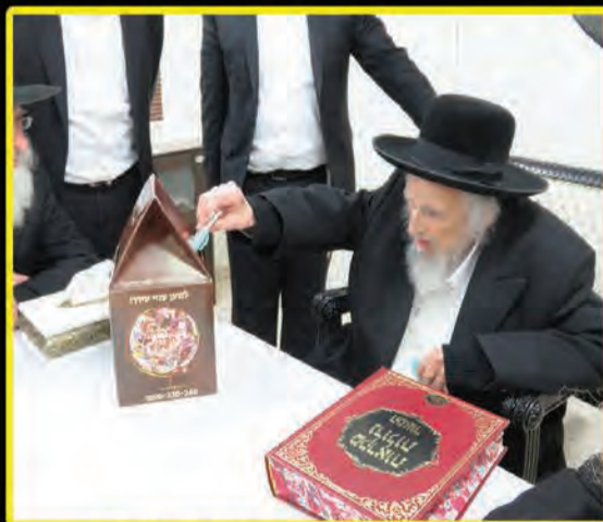
רבנו מרן ראש הישיבה זצוק"ל פותח את מגבית פורים "מתנות לאביונים" שע"י קופת הצדקה "חסדי שלום" אדר ה'תשע"ח