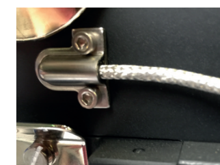
Temperatuursensor Dubbele uitlezing 3 mm