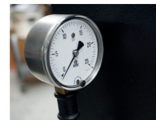
Manometer mBar of waterkolom