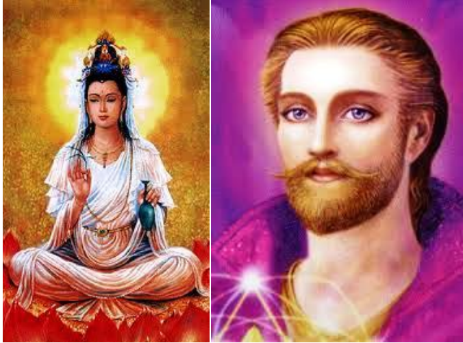
Lady Quan Yin Graf St. Germain

Seit mehr als 15 Jahren hat die Kabale, insbesondere die RKM, alle mit ihnen abgeschlossenen Verhandlungen und Verträge gebrochen, welche uns unser goldenes Zeitalter beschern sollten. NICHTS wurde von ihnen bisher eingehalten.