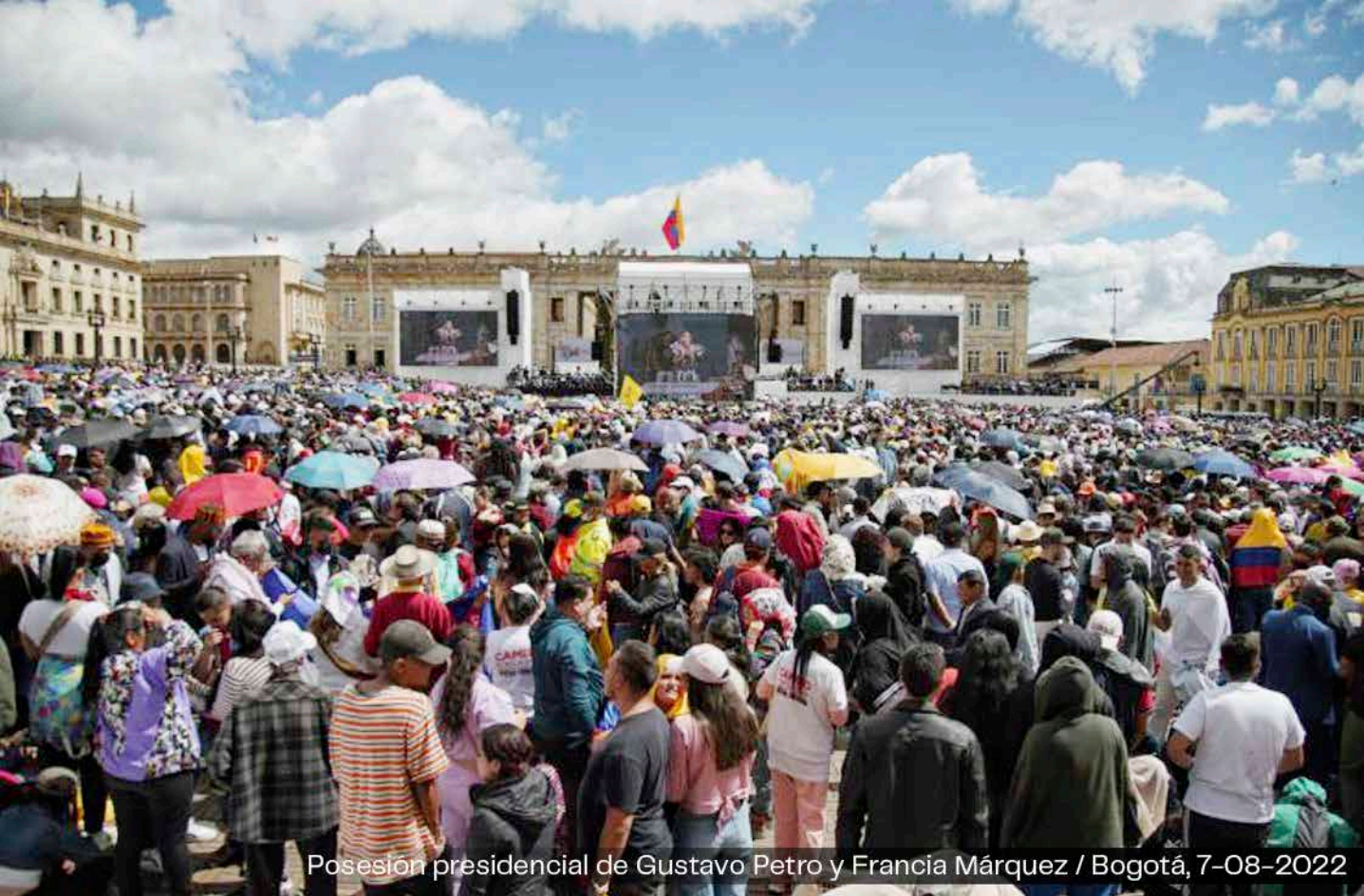
Posesión presidencial de Gustavo Petro y Francia Márquez / Bogotá, 7-08-2022