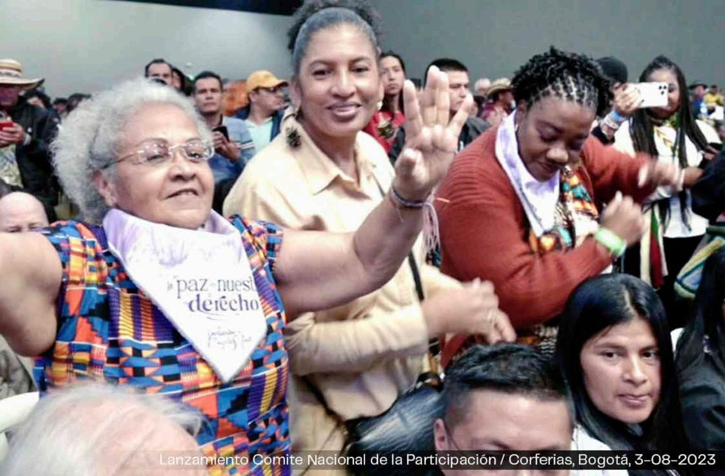
Lanzamiento Comité Nacional de la Participación / Corferias, Bogotá, 3-08-2023