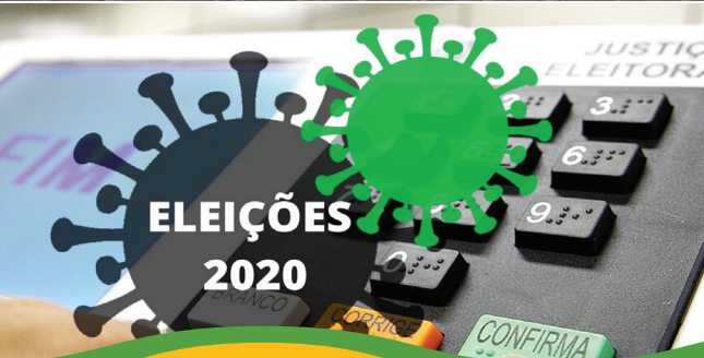
Deus é Fiel!

Saiba mais sobre as Eleições 2020, no Entorno do DF