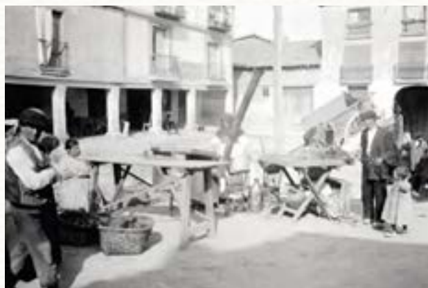
Feria de la madera en el Arco Isilla en 1910. Los soportales que vemos a la izquierda se conservan todavía y son los de los bares la Perla y Santos.

nización, pues con la desaparición de este edificio se dará amplitud a la plaza Primo de Rivera 7 en su confluencia con la calle de San Gregorio, encontrándose situada esta ampliación en la carretera general de Madrid a Irún. Este es el primer paso para la gran avenida que en su día constituirá esta arteria principal de Aranda 8 .