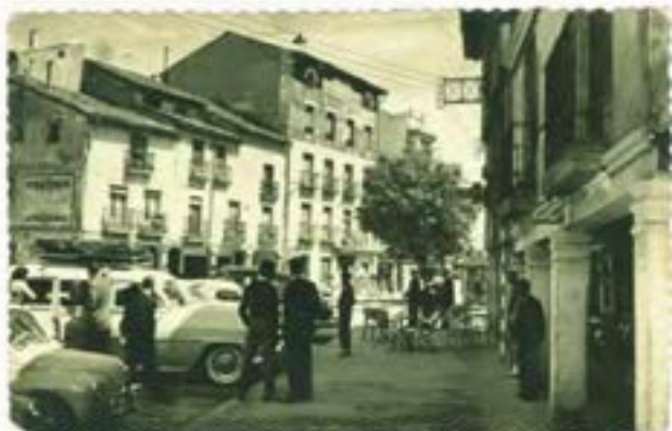
La plaza Arco Isilla en 1957.