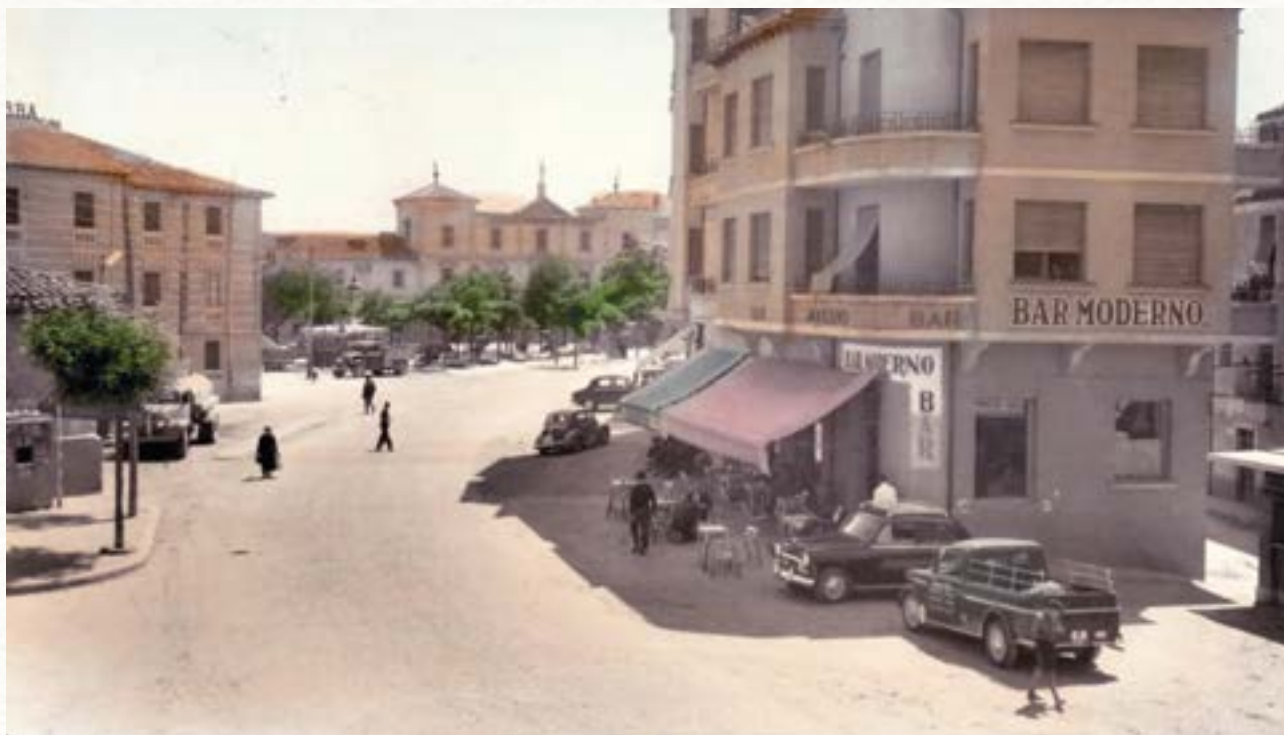
La Plaza de la Virgencilla y los Jardines de Don Diego hacia 1960.

En la plaza de la Virgencilla también se instalará una gasolinera para que pudieran repostar los numerosos vehículos que pasaban por la carretera. Se elige esta ubicación por estar a pie de carretera y muy próxima a los dos establecimientos hoteleros que existían en aquel momento, el Hotel Ibarra y el Hotel Castilla. La gasolinera pertenecía entonces a Campsa (Compañía Arrendataria del Monopolio de Petróleos, Sociedad Anónima), una empresa pública creada en 1927 por la Ley del Monopolio de los Petróleos. En 1930 la empresa da cuenta de los logros obtenidos desde su fundación. Habla de que, para dar un mejor servicio, ha instalado gasolineras en un total de 30 puntos estratégicamente elegidos, entre los que menciona el de Aranda de Duero 32 . En la capital de la Ribera Campsa instaló unas oficinas para dar servicio a la comarca. Como dato curioso señalamos que el segundo premio de la lotería nacional del 2 de enero de 1934 (el actual sorteo del Niño) tocó en Aranda gracias a las participaciones que se repartieron del número 45.522 entre los clientes de la gasolinera de la Virgencilla, así como entre los propios empleados 33 . Alrededor de la gasolinera empezaron a proliferar establecimientos que daban servicio a los automovilistas como talleres