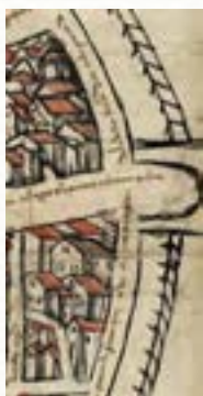
Detalle del plano de 1503. Arco de la Dehesilla.

sus murallas 10 . Lo cierto es que, tal como se refleja en el plano de Aranda de 1503, el recinto amurallado únicamente tenía seis puertas. Fue posteriormente cuando se añadió la de Cascajar, lo que luego se llamó el Arco Pajarito. En la representación del plano llama la atención que tres de las puertas, entre otras la de Isilla, se salgan del plano, de manera que el borde del mismo corta la parte superior de cada uno de estos tres arcos 11 . Probablemente esto se deba a que el plano se recortara tras ser dibujado. El nombre de Isilla evoca la dehesilla, la pequeña dehesa que existía antes de ampliarse el recinto amurallado en los años de transición entre los siglos XIV y XV. La otra plaza a la que nos estamos refiriendo en estas páginas, la de la Virgencilla, también debe su denominación a un diminutivo terminado en “illa”. Al igual que sigue sucediendo en Andalucía y otros países hispanohablantes, el diminutivo terminado en “illo” y en “illa” era el predominante en el castellano de aquella época. En nuestro callejero también está presente en calles como Costanilla y Francesillas, o la plaza Romualdillo.