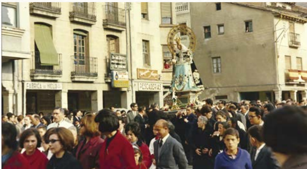
La Virgen de las Viñas pasa por el Arco Isilla el 4 de abril de 1965 en el regreso a su ermita tras el incendio del verano anterior.

ferial, se debían revitalizar, incluso creando lugares espaciosos nuevos junto a los caminos 19 . Los actuales Jardines de Don Diego fueron hasta bien entrado el siglo XX un gran espacio donde se celebraban las ferias, especialmente conocidas las ferias de ganado y de productos de la madera. Por ello, junto con el nombre de Plaza del Palacio por encontrarse allí el del obispo, también era conocida como la Plaza de la Feria.