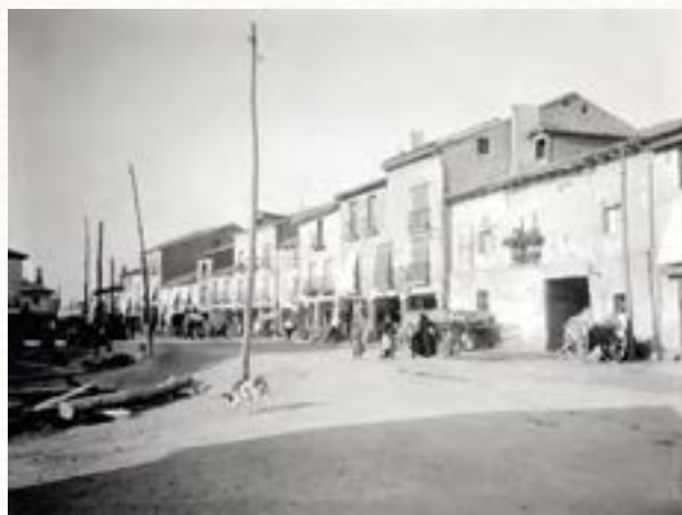
Confluencia del Arco Isilla, la Virgencilla y Carrequemada en 1910.

CORREOS Y DILIGENCIAS. Pasa todos los días la mala de Francia de 4 a 6 de la mañana, saliendo para Madrid a los 15 ó 20 minutos, después de haber cambiado el tiro y tomado la correspondencia de Aranda. Este mismo correo llega también diariamente de la Corte de 5 a 6 de la tarde, siendo conducido en coches de 7 asientos, que llevan al mismo tiempo viajeros particulares y por cuenta del Gobierno (...) En los meses de diciembre a mayo corren de Madrid a Francia y viceversa, un día las diligencias generales de España y otro las Peninsulares; esta última empresa mantiene en los restantes el mismo servicio, y la primera pone una góndola diaria y otra de 3 en 3 días: ambas pasan por la mañana en una y otra dirección, cambiando de caballos y tomando el desayuno o almuerzo 24 .