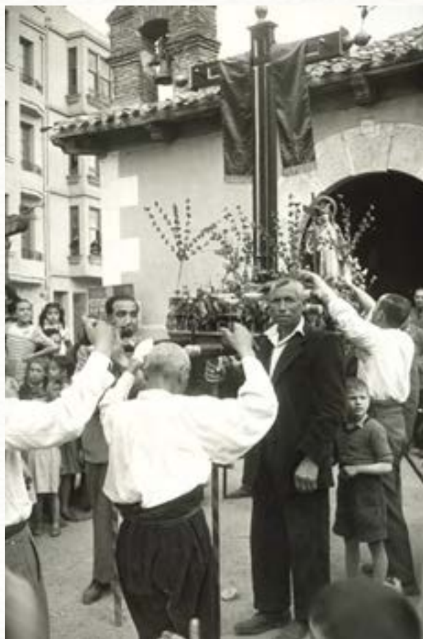
Procesión de la Reina Elena frente a la entrada de la Virgencilla hacia 1955.

Todos los años, en las vísperas septembrinas de la Natividad de Nuestra Señora, un campanil, en lo alto de su espadaña, anunciaba la festividad de la Virgencilla en la ermita de su nombre al comienzo de la calle de San Gregorio, uno de los barrios más antiguos de Aranda. El Ilustrísimo señor don Silverio Velasco, entre las 16 ermitas que como restos de la piedad medieval se conservaban en nuestra villa en el reinado de Alfonso XI a finales del siglo XIV, cita la de San Gregorio que dio el nombre a aquel arrabal, expandido puertas afuera de la muralla. Pasados los años, exactamente el 20