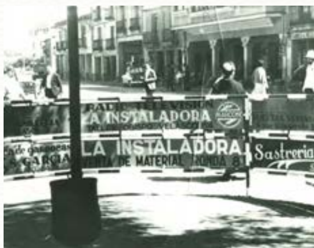
Cruce del Arco Isilla hacia 1960.

En el plano de 1503 figura en la calle Isilla una especie de escala para hacerse la idea de las dimensiones del resto de calles,