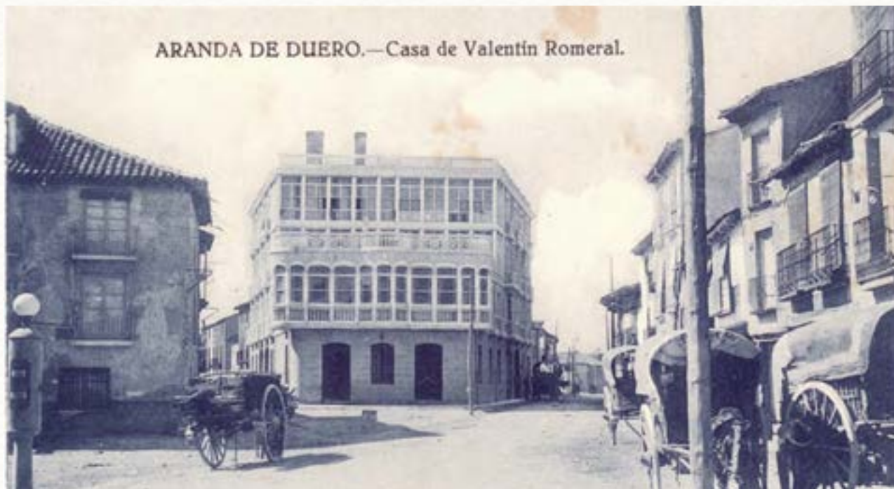
Edificio Valentín Romeral hacia 1925.