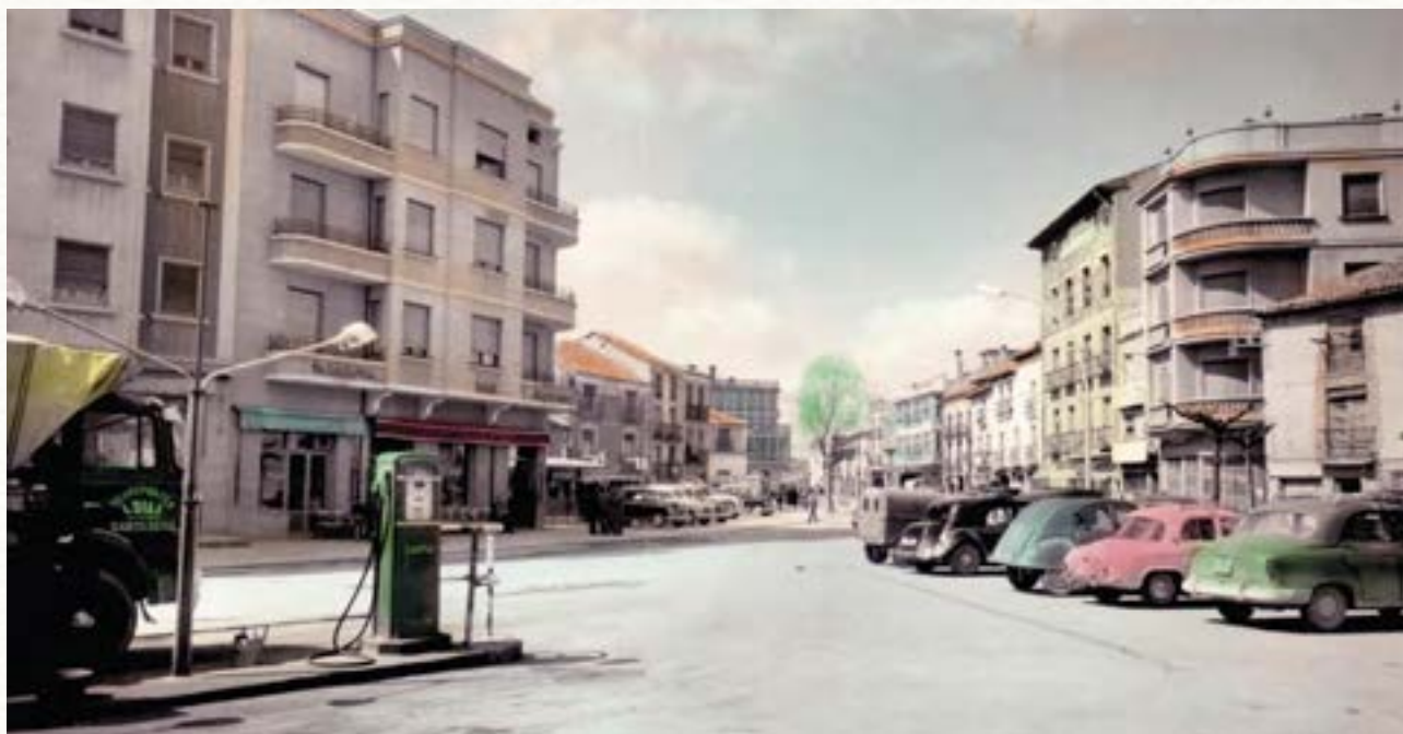
Plaza y gasolinera de la Virgencilla hacia 1965.

realidad, pero el periodista de Aranda ya señalaba en el verano de 1964 lo siguiente: