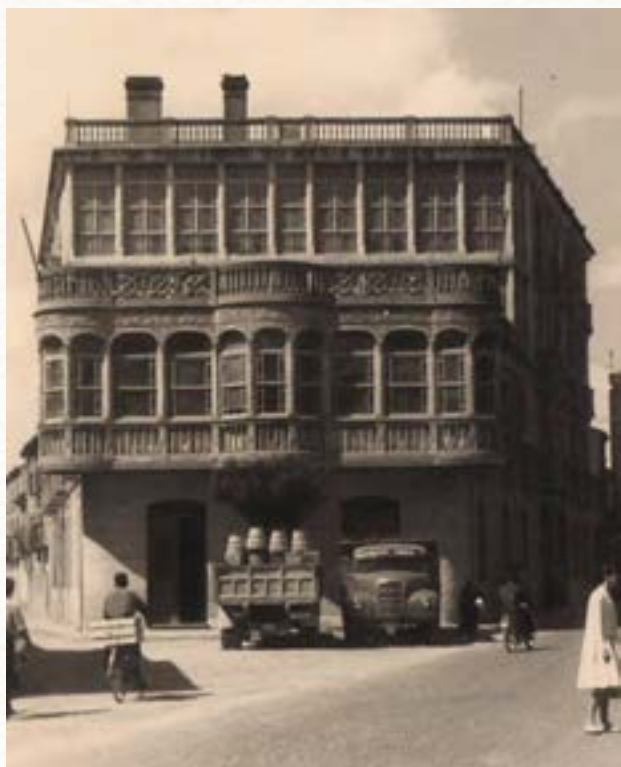
Edificio Valentín Romeral hacia 1955.

transversales casi en su totalidad son hoy susceptibles, en virtud de los últimos reparos, del transporte en carros sin peligro de las averías y detenciones que eran tan frecuentes. Por el adjunto estado que tengo el honor de elevar a la superior consideración de V. E. se patentiza la actividad desplegada por los ayuntamientos, a los que no dejaré de la mano hasta ver terminado este útil proyecto, cuyos resultados son tan lisonjeros, y cuya bondad y certeza en los partes dados he tenido ocasión de cotejar por mí mismo en las diferentes salidas de esta capital. Dios guarde a V. E. muchos años 26 .