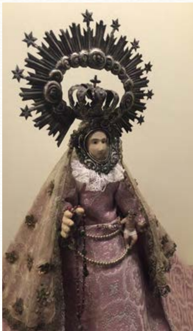
La Virgencilla (Museo Sacro de San Juan).