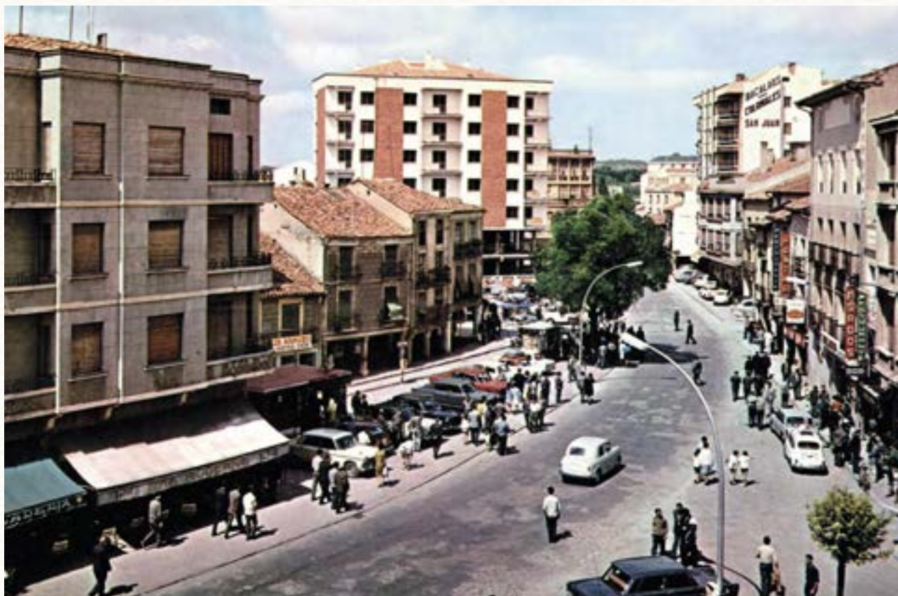
La Plaza de la Virgencilla hacia 1970.

o un distrito, porque siendo la conducción a lomo la más dispendiosa de todas, sucederá que a poco que esté distante el mercado o punto de consumo, el precio de los portes encarezca tanto sus frutos que los haga invendibles y en tal caso está indicada la necesidad de una carretera para abaratarlos 22 .