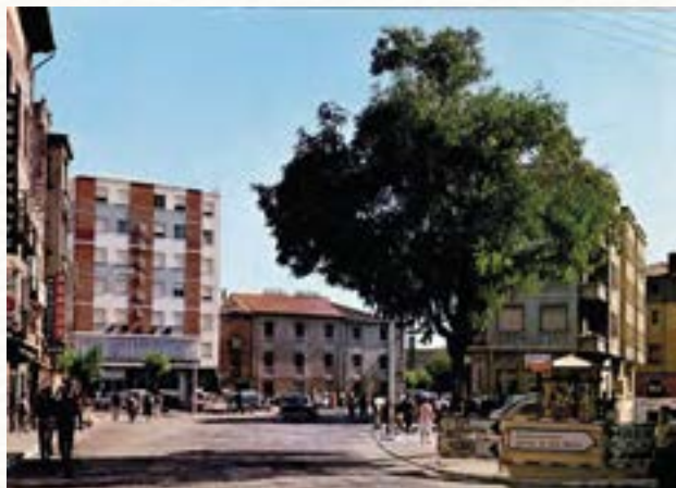
La Plaza de la Virgencilla en 1967.