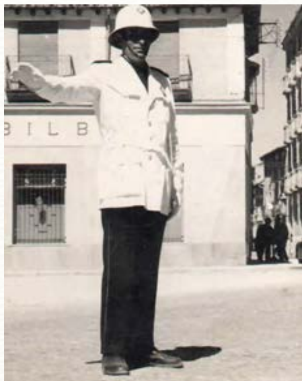
Policía dirigiendo el tráfico en el cruce del Arco Isilla en 1957.

de la posibilidad de instalar semáforos en Aranda y en principio parecía que esto iba a ser así. Las dos ubicaciones propuestas eran las mismas donde en aquel momento había un guardia dirigiendo el tráfico. Pasarán muchos años antes de que esto se haga una