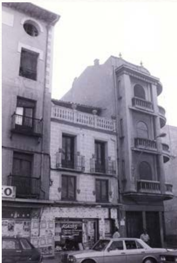
Edificios de la plaza de la Virgencilla en 1978 .

El Arco Isilla, tras su función defensiva, sirvió también como fielato, como lugar de control de los productos que venían de fuera de la localidad y así cobrar el correspondiente arbitrio. Igualmente servía de control en tiempo de epidemia y evitar la entrada de personas sospechosas de estar contagiadas. Un rincón de Aranda con tantos siglos de Historia como es el Arco Isilla hace que figure en numerosos documentos. En un testimonio ante el Tribunal de la Inquisición de 25 de octubre de 1501 nos encontramos con Pedro de Valmaseda, de profesión cerrajero y que vivía en “la Puerta de Esilla” 14 . El paso de la Historia también lo encontramos durante la I Guerra Carlista (1833-1840) cuando vemos que el Arco Isilla fue utilizado para colgar proclamas a favor del pretendiente tradicionalista y mensajes en clave. Así nos encontramos con el siguiente escrito de la época: