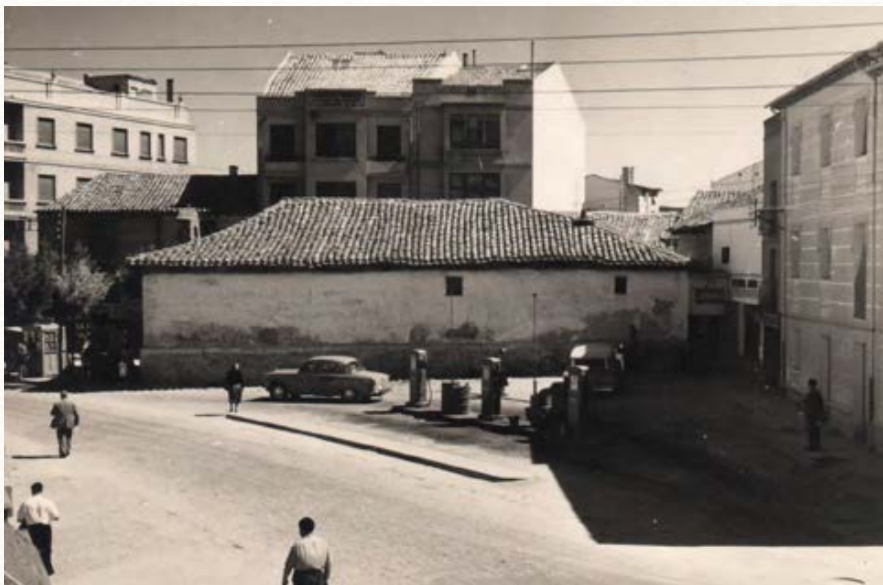
La ermita de la Virgencilla en 1957.