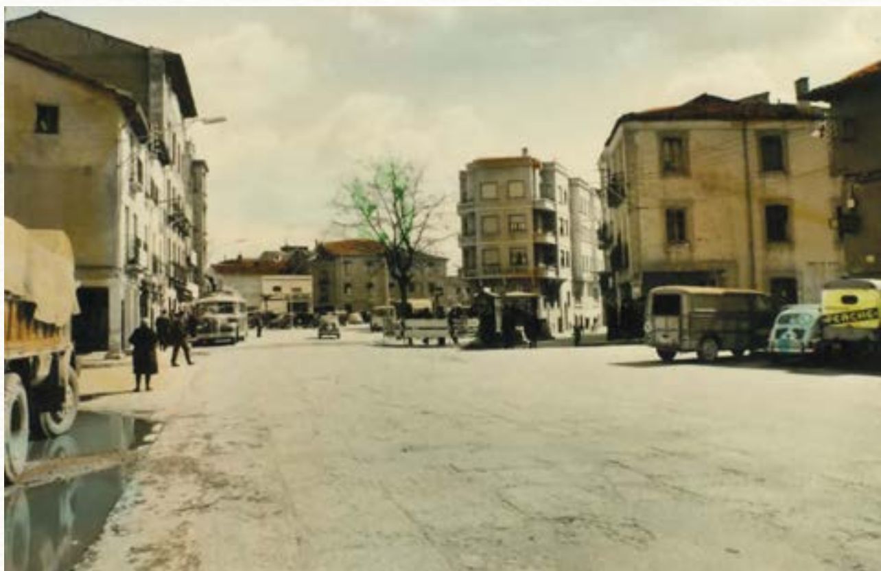
Arco Isilla y Plaza de la Virgencilla en los años 60.

Bordeando el recinto amurallado transcurría antiguamente el Camino Real, lo que acabará convirtiéndose en la carretera N-I. Esta vía de comunicación adquirirá gran importancia económica cuando la villa de Madrid es designada en 1561 como capital de la Corte por el rey Felipe II. La situación geográfica de Madrid resultaba muy ventajosa para la administración del Reino, ya que prácticamente coincidía con el centro geográfico de España y se ubicaba a distancias semejantes de sus puertos principales y de los pasos fronterizos con Francia y Portugal. La carretera que transcurre por Aranda se convierte en la ruta más habitual entre Madrid y Francia, frente a otro itinerario que pasa por las actuales provincias de Soria, La Rioja y Navarra. La villa de Aranda es lu-