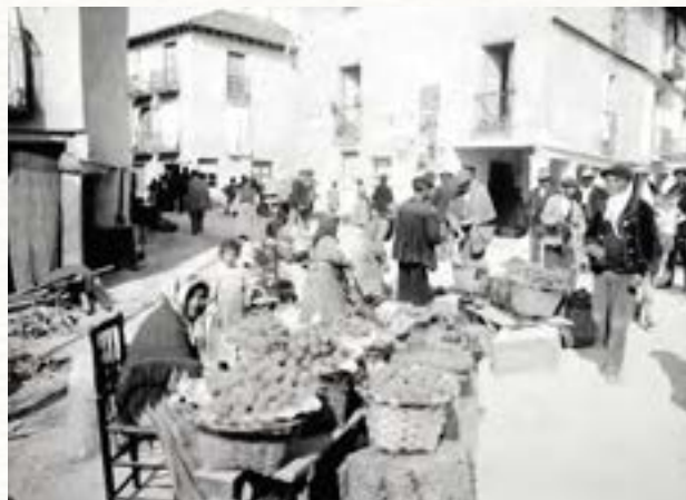
Venta de productos del campo en el Arco Isilla en 1910.

sus murallas 10 . Lo cierto es que, tal como se refleja en el plano de Aranda de 1503, el recinto amurallado únicamente tenía seis puertas. Fue posteriormente cuando se añadió la de Cascajar, lo que luego se llamó el Arco Pajarito. En la representación del plano llama la atención que tres de las puertas, entre otras la de Isilla, se salgan del plano, de manera que el borde del mismo corta la parte superior de cada uno de estos tres arcos 11 . Probablemente esto se deba a que el plano se recortara tras ser dibujado. El nombre de Isilla evoca la dehesilla, la pequeña dehesa que existía antes de ampliarse el recinto amurallado en los años de transición entre los siglos XIV y XV. La otra plaza a la que nos estamos refiriendo en estas páginas, la de la Virgencilla, también debe su denominación a un diminutivo terminado en “illa”. Al igual que sigue sucediendo en Andalucía y otros países hispanohablantes, el diminutivo terminado en “illo” y en “illa” era el predominante en el castellano de aquella época. En nuestro callejero también está presente en calles como Costanilla y Francesillas, o la plaza Romualdillo.