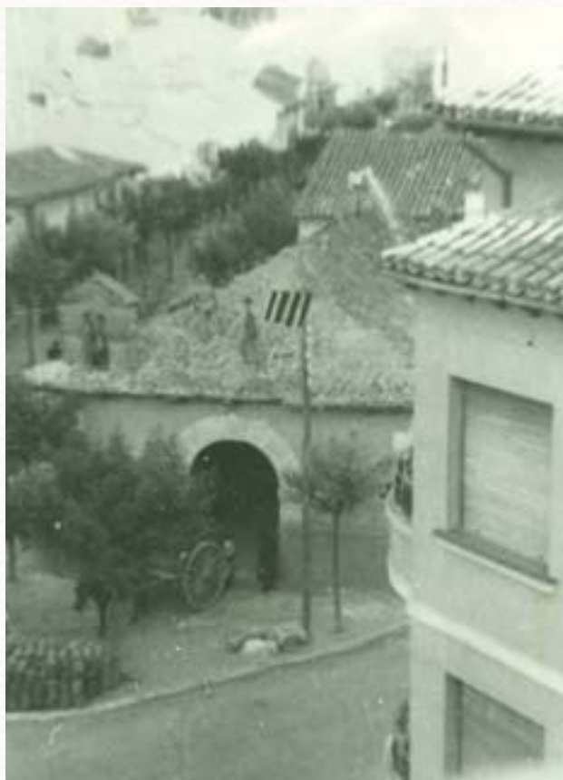
Derribo de la Virgencilla en 1957.