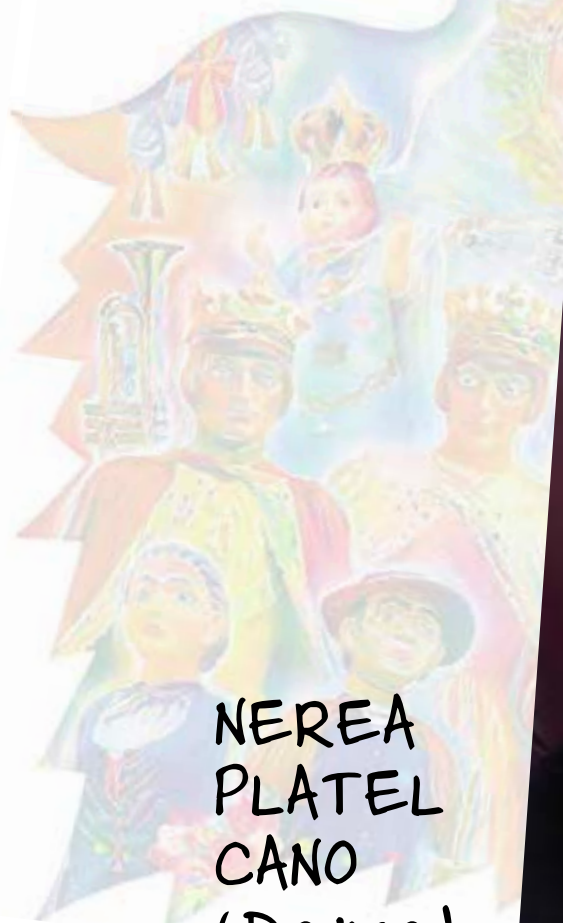
NEREA PLATEL CANO (Dama)