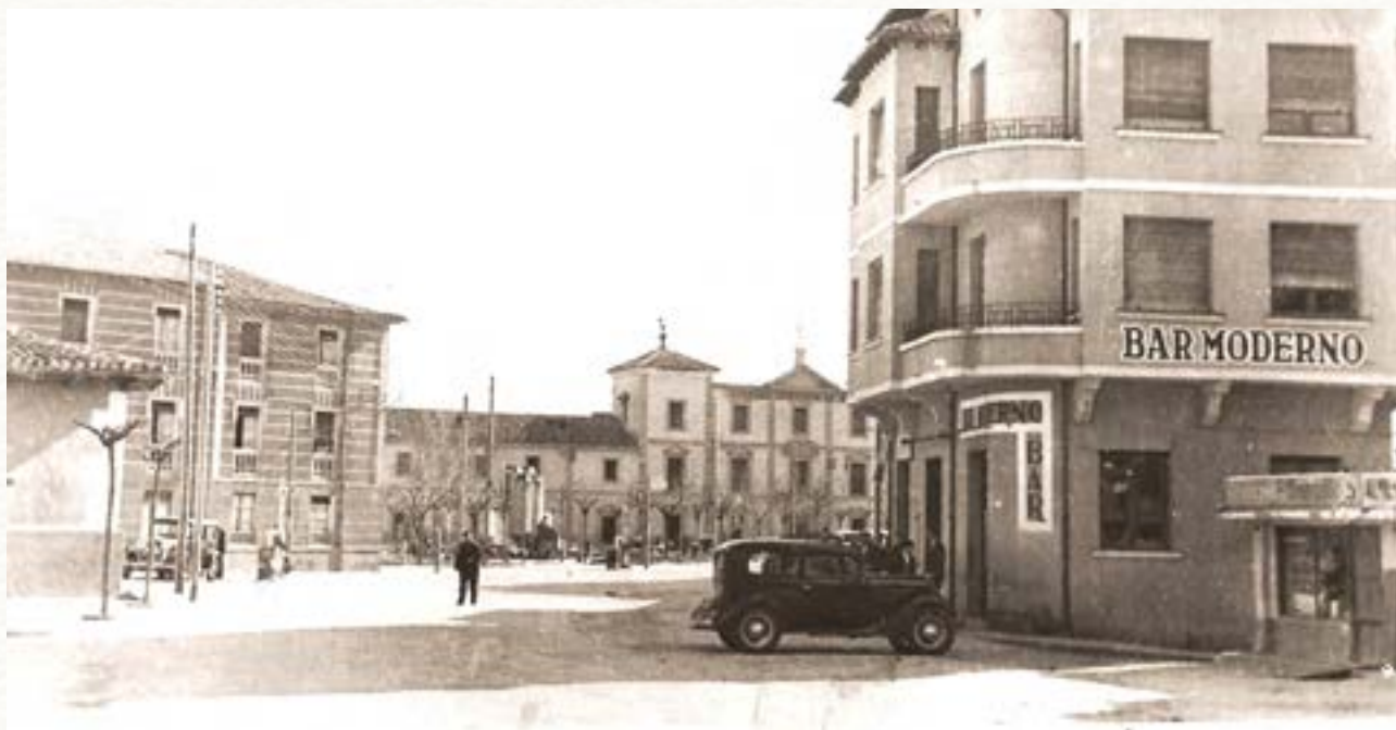
La plaza de la Virgencilla hacia 1945.

desempleo, no teniendo tal obligación respecto al personal técnico. En lo que afectaba a la Ribera del Duero se programaron tres tramos: desde Honrubia hasta Aranda, la travesía urbana y semiurbana de Aranda y un tercer tramo hasta Quintanilla de la Mata. Esta obra se inició durante el verano de 1928 ya que para echar el betún asfáltico con piedra cuarcita se necesitaba que hiciera calor. En este tramo se utilizará piedra de Honrubia para la calzada y de Milagros para los bordillos. Por último, para el resto de tramos se adoptó un riego asfáltico superficial que en todos los casos iría con un bordillo de piedra de Milagros. La travesía de Aranda, desde el puente hasta la actual Plaza Doctor Costales, la acometerá el contratista Díaz Tolosana y será de riego asfáltico en profundidad 29 . Dentro de este plan de modernización de la carretera general también se incluyó ensanchar el puente de San Francisco, sobre el Bañuelos. Para financiar el Circuito Nacional de Firms Especiales, además de la aportación del Estado, se estableció un presupuesto extraordinario financiado por nuevas figuras impositivas: una tasa especial de rodadura sobre automóviles y carros, otra tasa de 0,50 pesetas por cada habitante de los municipios beneficiados a pagar por los ayuntamientos y un canon sobre las empresas de transporte. Es también