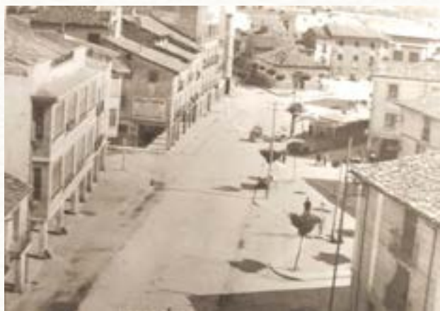
Vista general de la plaza de la Virgencilla y de Arco Isilla hacia 1950.