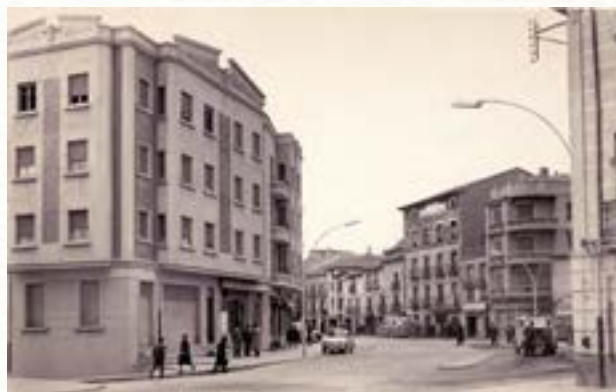
Plaza de la Virgencilla, años 60.

En Aranda de Duero se hallan fijadas tres ridículas proclamas subversivas, de casi igual contenido, firmadas por un tal Santiangelo.