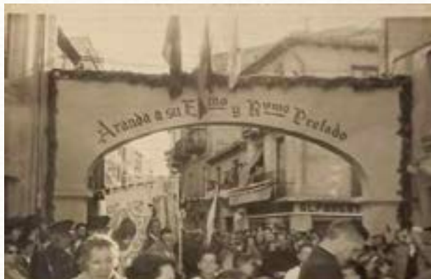
Arco efímero levantado en el Arco Isilla con motivo de la visita del obispo en 1958.