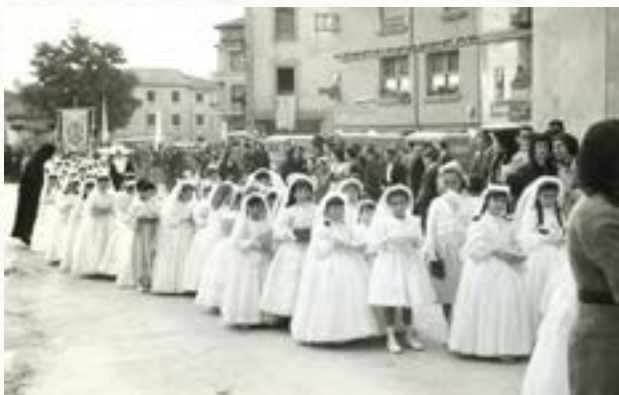
Niñas de primera comunión a su paso por el Arco Isilla durante una procesión del Corpus de los años 50.