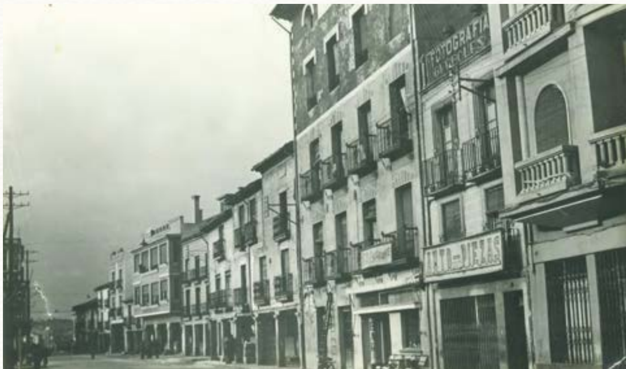
Confluencia de la Virgencilla con el Arco Isilla hacia 1950.

Los lugares en que se encuentran son los edificios extramuros y contiguos a la carretera de Francia, convento de San Francisco, colegio de Vera-Cruz y arco de la puerta de la muralla titulada de Isilla. Copiamos una de las referidas, con la misma ortografía y puntuación con que están escritas: