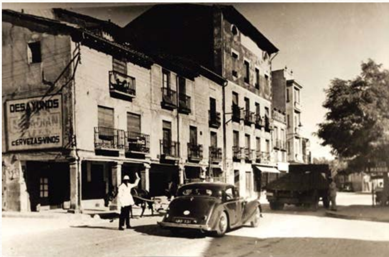
Cruce del Arco Isilla hacia 1945.

las postas reales y correos, de 7 millas. Cada una de las diferentes motivaciones del desplazamiento generaba unos ritmos de tráfico, condicionando la organización del camino en tramos. Las diferentes etapas requerían el establecimiento espaciado de equipamientos y servicios para el viajero como mesones, talleres, establos, fuentes, cuarteles... Asimismo la jornada común la dividía en 16 millas por la mañana y 12 por la tarde, y la de tropa en 8 por la mañana y 6 por la tarde. Desde este planteamiento, en los caminos reales cada dos millas debía haber una taberna donde se vendiese vino y pan, y cada cuatro millas un mesón espacioso con lo necesario para los arrieros. Cada siete millas, como común denominador de los tres tipos de jornadas, debía ubicarse un núcleo con el mayor número de servicios. En los términos extremos de la jornada, o cada 28 millas, Martín Sarmiento señalaba que tenía que haber lo siguiente: