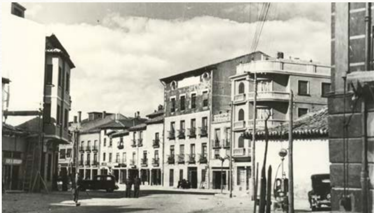
La Plaza de la Virgencilla hacia 1950.

y peatones fue contada así en Diario de Burgos en el verano de hace 65 años: