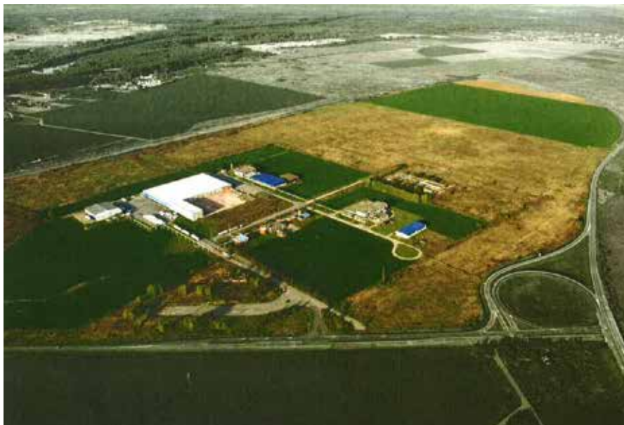
Nemetin je prva zelena industrijska zona u Hrvatskoj. Potkraj rujna, nakon završetka gradnje, počela su ulaganja

Grad Osijek središte je urbane aglomeracije Osijek, s 19 jedinica lokalne samouprave, uza zagrebačku, najveće aglomeracije u Hrvatskoj. To je također aglomeracija s najnižim stupnjem razvijenosti koja znatno zaostaje za nacionalnim prosjekom. Urbana će aglomeracija Osijek u sklopu mehanizma Integriranih teritorijalnih ulaganja (ITU) pridonijeti stvaranju povoljnije okoline za poduzetnike, obnoviti će kulturnu baštinu i staviti u funkciju gospodarstvo te zapuštena područja s pomoću 'brownfield'-investicija. Poboľjšat će se javni prijevoz, osmisliti mjere za unaprjeđenje obrazovanja za odrasle i osuvremeniti ponuda strukovnog obrazovanja. Mehanizam ITU-a u Hrvatskoj se primjenjuje za razvoj urbanih područja, njime je za sedam hrvatskih gradova osigurano više od 345 milijuna eura.