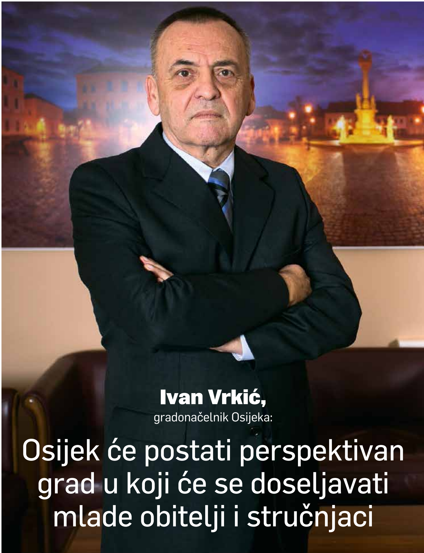
Ivan Vrkić, gradonačelnik Osijeka:

Osijek će postati perspektivan grad u koji će se doseljavati mlade obitelji i stručnjaci