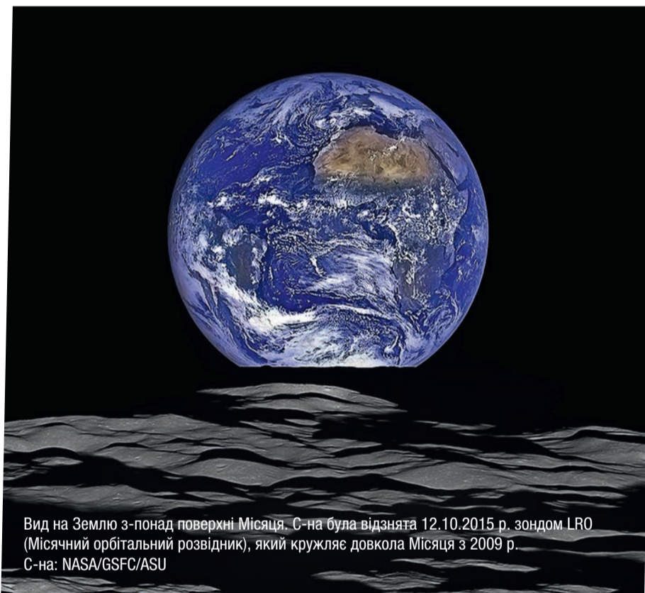
Вид на Землю з-понад поверхні Місяця. С-на була відзнята 12.10.2015 р. зондом LRO (Місячний орбітальний розвідник), який кружить довкола Місяця з 2009 р.

Із виступу Джорджа Сороса на економічному форумі в Давосі в січні 2020 р. Подано за: «Погляди НВ»; текст скорочено