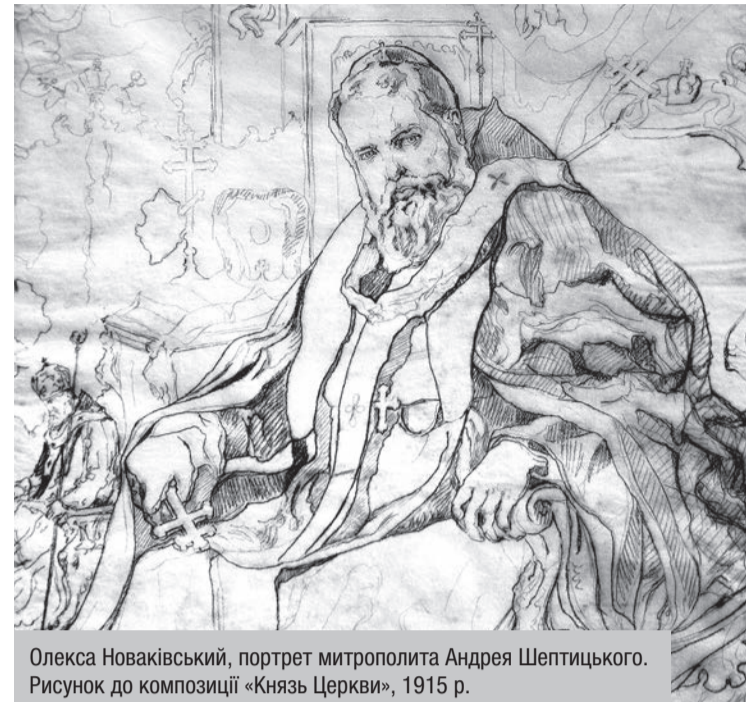
Олекса Новаківський, портрет митрополита Андрея Шептицького. Рисунок до композиції «Князь Церкви», 1915 р.

Не сумніваймося ані на хвилю, що наші молитви будуть вислухані. Дасть Бог Духа Святого нашому народові, і та бідна і дорога Руська земля, яка