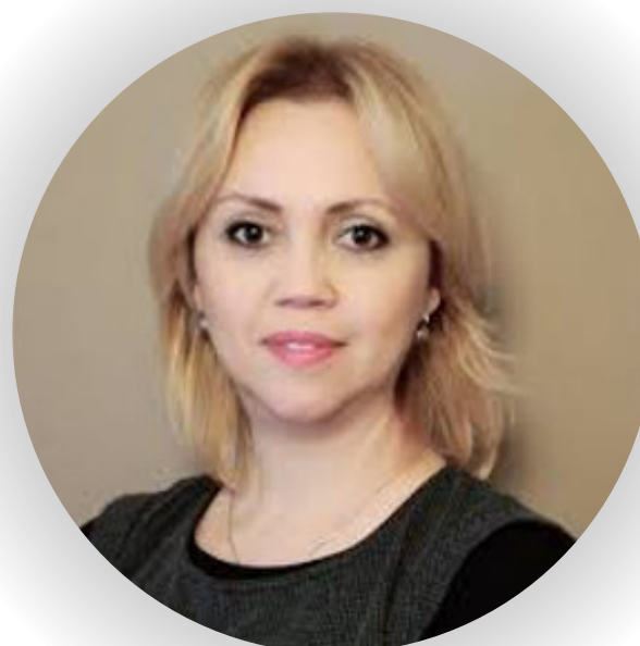
Lejla Šehić Relić Predsjednica HCRV-a