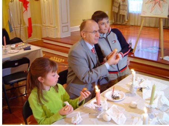
Два Осташі між собою: – "А моя писанка краца!"