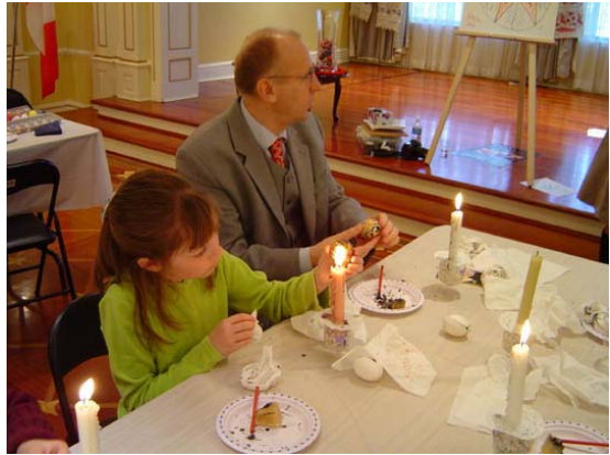
"І що б його там ще домалювати?..."