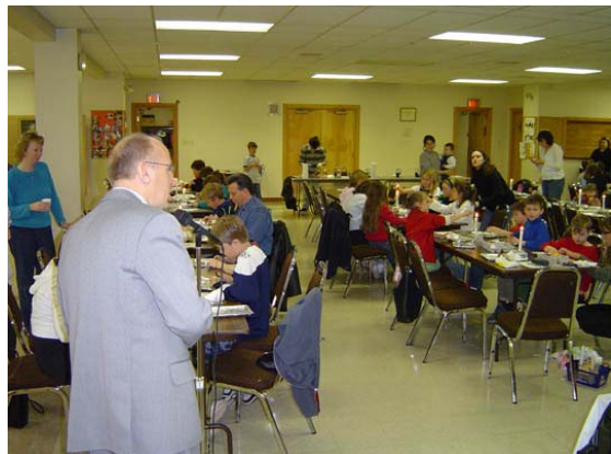
Розпис писанок у школі.