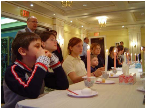
"Але ці дітлахи... Ну, хоч би на яєчню залишили".