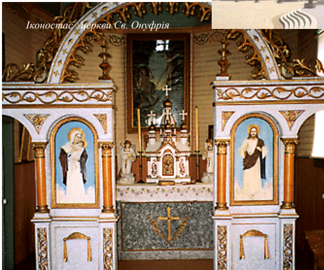
Іконостас церкви Св. Онуфрія

столиці у цей час, варто відвідати в ній Богослужіння. Після служби у церкві, процесія на чолі із священниками виходить через весь музей, завжди повен відвідувачами, на подвір'я, і там, біля складеного напередодні триметрового льодового хреста на березі продовжує обряд водосвяття і свячення води річки Оттави. Це дійство на фоні Парламенту, а саме звідти відривається найліпше його вигляд з квебецького боку столиці, справляє незабутнє враження.