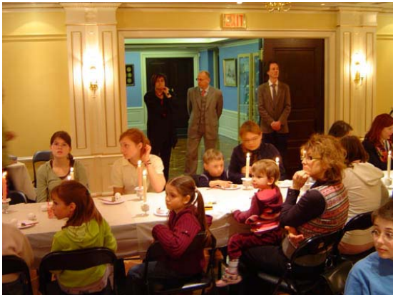
"Гмм... А де ж я оце бачив останній раз... наш посольський вогнегасник?..."