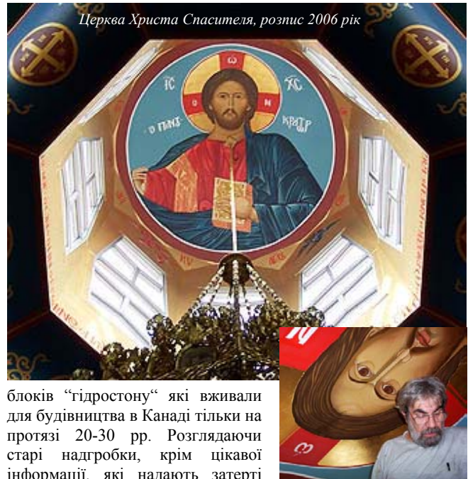
Церква Христа Спасителя, розпис 2006 рік

Неподалік центру Оттави, на вулиці Somerset, тепер вже в самому епіцентрі китайського кварталу безпомилково вирізняється ще одна українська церква, яка бере свої початки на зорі освоєння українськими парафіянами Оттави (раніше Holy Trinity Bukovynian Greek Orthodox Cathedral) і нещодавно передана Carpatho-Ruskij Orthodox Diocese та перейменована на Christ the Saviour Orthodox Church. Від старої парафії в західній частині Оттави залишився на 1890 Merivale Буковинський цвинтар, який вже належить до історичної спадщини. Взагалі, як згадувалося вище про розбіжності при встановленню перших церков, цвинтарів там є два, але всім оттавцям він відомий під загальною назвою - Bukowinian Greek Orthodox Cemetery. Цвинтар добре проглядається з дороги, на вході стоїть українська каплиця Святої Трійці збудована з 30-х роках минулого століття з спеціального будівельного матеріалу -