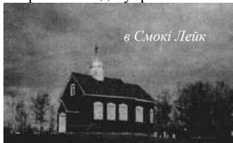
в Смокі Лейк

В музею Цивілізації знаходяться також і інші експонати, пов'язані з канадськими українцями, зокрема експозиція українського книжкового магазину початку минулого століття з безліччю оригінальних старих речей. Але щодо самої старенької церкви св. Онуфрія, то варта уваги і її історія, бо вона являється повністю єдиним справжнім експонатом музею, а не діорамою чи копією, як решту експозицій музею. Церква була збудована 1907 року в Smoky Lake і згодом перероблена французьким отцем Філіпом Ру, який збудував понад 30 українських церков в західній Канаді. Отець Ру був одним з перших греко-католицьких місіонерів європейського походження, який спеціально вчився в Галичині і з групою інших священників був направлений до українських піонерів у прерії Канади. З часом, парафія св. Онуфрія Перестала існувати, так як люди поволі переселилися в інші місця залишаючи біля неї однойменний цвинтар, а саму церкву після переговорів з Оттавою, 1996 р. перевезли до приміщення музею, де її