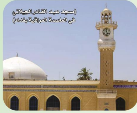
(مسجد عبد القادر الجيلاني في العاصمة العراقية بغداد)

قال البروفيسور (محمد فاضل الجيلاني) الحفيد الـ 23 للعالم الإسلامي المعروف الشيخ (عبد القادر الجيلاني) إنه عثر على 28 كتاباً لجده، بينها أربعة في مكتبة الفاتيكان، مشيراً إلى أنه نشر منها 14. وأشار الجيلاني الحفيد - في حديث صحفي - إلى أنه أجرى بحثاً في أربعمئة مكتبة منتشرة في ثلاثين بلداً حول العالم بهدف العثور على مؤلفات ضائعة لجده ونشرها، موضحاً أنه عثر على تلك الكتب خلال أبحاث تمت على مدار 35 عاماً. وأوضح البروفيسور الجيلاني أنه بدأ بحثه من المدينة المنورة في المملكة العربية السعودية، مروراً بالأردن، ولبنان، وسوريا، والعراق، ومصر، وصولاً إلى الفاتيكان. ولفت إلى أنه عثر في مكتبة الفاتيكان على أربعة كتب يعود تأليفها لجده الشيخ الجيلاني، وأن أحدها تم نشره تحت اسم "هل أستطيع رؤية النبي - صلى الله عليه وسلم - في المنام؟". وأشار البروفيسور إلى أن داخل كل من المؤلفات - التي كانت في الفاتيكان - ملحوظة توضيح البطل الذي وصل الكتاب منه إلى مكتبته، لكن من دون ذكر كيفية الوصول إليها.