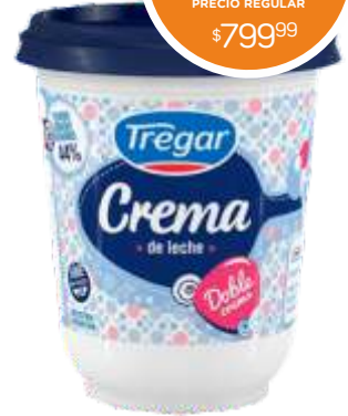
CREMA DE LECHE TREGAR 350 cc