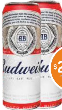
CERVEZA BUDWEISER Lata 410 cc