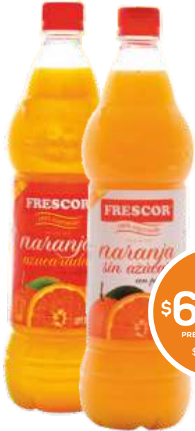
JUGO FRESCOR Naranja Azúcar - Naranja Light - Naranja Natural 980 cc