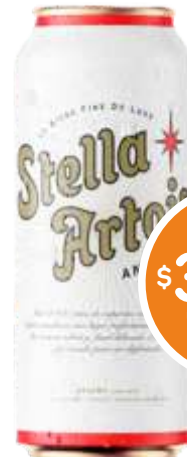
CERVEZA STELLA ARTOIS Lata 473 cc