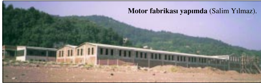
Motor fabrikası yapımında (Salim Yılmaz).

15 Eylül 1978'de, Abana Belediyesi 'nin ortaklık karşılığı olarak verdiği Harmason 'daki 26.700 m 2 'lik arsa üzerinde altyapı çalışmaları başlar.