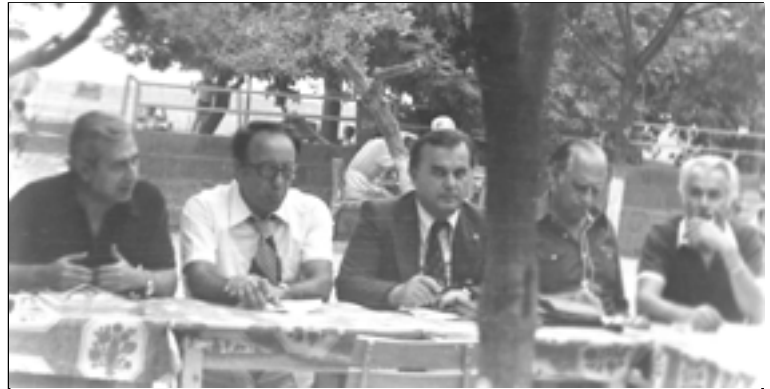
Belediye Bahçesi’nde yapılan toplantılardan birinde fabrika yönetim kurulu üyelerinden kimileri.

Daha sonra bu ortak adayıyla da fabrika kurulamaz. Yeni ortak adayı İsviçre ’den “ Landert Motoren AG ”dir. Bu kuruluş ile 1977 Ocak’ında “ Lisans Anlaşması ” imzalanmış, “ proje ve fizibilite ” çalışmalarına başlanmış ve Almanya ’nın “ İşçi Şirketlerine Yardım Fonu ”ndan 50.000 DM bağış sağlanmıştır. Kuruluş Haziran 1977’de tamamlanacaktır.