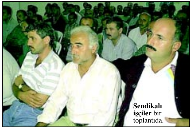
Sendikali işçiler bir toplantıda.