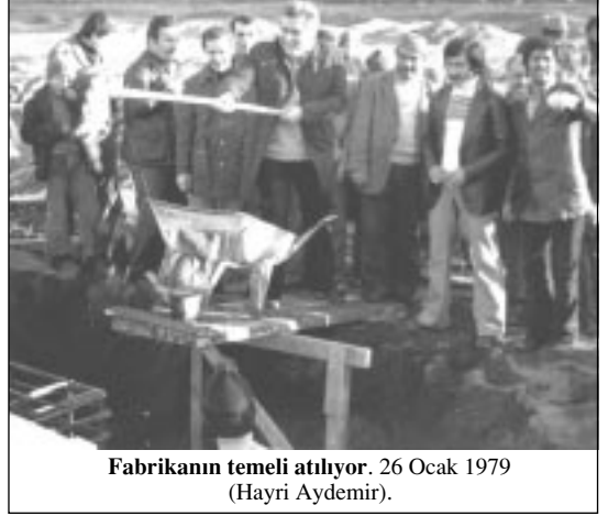
Fabrikanın temeli atılıyor. 26 Ocak 1979 (Hayri Aydemir).