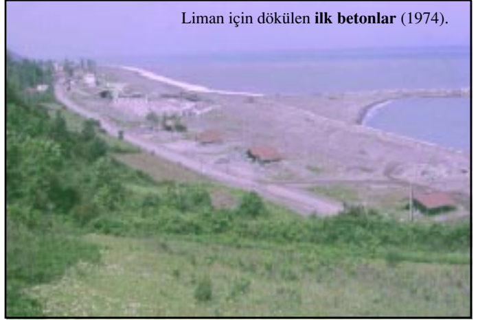
Liman için dökülen ilk betonlar (1974).

Marshal yardımı destekli projeyi 1957’de Hollandalılar yapar. Bizim gemicilerin saptadıkları “4,5 metre dalga yüksekliği” de doğru çıkar. Ama büyük paralar harcanan bu proje, Bayındırlık Bakanlığı ’ndaki dosyalara konulup unutturulur. Yalnız Abana değil, Cide ve İstafan (Ayancık) limanları da yapılmamıştır.