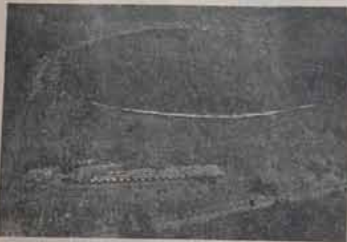
Fotografin doğrusu

Abana'dan kopan diğer hemşehrilerimizin de Abana'yı unutmayacağı gerçeği bu gibi örneklerle zaman zaman ortaya çıkmaktadır. Bir Abana'lı olarak bununla özünüyoruz.