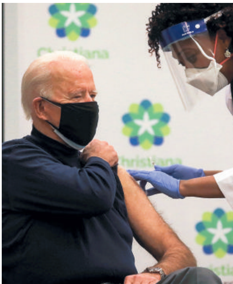
Il presidente eletto degli Usa, Joe Biden, riceve la dose di vaccino anti-Covid