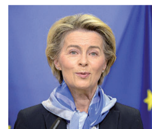
Ursula von der Leyen

C'è il via libera: l'Europa può vaccinarsi contro il Covid. Ieri è arrivato l'ok anticipato dell'Agenzia europea del farmaco per la distribuzione ai 27 Stati membri del vaccino Pfizer-Biontech. E anche la Commissione europea (un passaggio formale ma determinante) ha dato nel giro di poche ore il suo semaforo verde. «È una splendida notizia, il 27/12 si parte», scrive su twitter il presidente del consiglio, Giuseppe Conte nel giorno in cui i numeri del contagio risalgono ancora. Intanto è in isolamento a casa sua, a Roma, la «paziente 1» contagiata dalla nuova variante inglese del virus Sars-Cov-2. Al momento non presenterebbe alcun sintomo preoccupante, ma su di lei e su altri possibili casi di contagio provenienti dalla Gran Bretagna si sono accesi i riflettori delle istituzioni sanitarie e del governo italiano, con l'obiettivo di scongiurare la diffusione nel nostro Paese della nuova variante, che non sarebbe più letale né più resistente ai vaccini, ma comunque capace di diffondersi più rapidamente. L'Europa alza l'allerta ma non chiude tutti i collegamenti con Londra, mentre l'Italia ha già sospeso i voli fino al 6 gennaio.