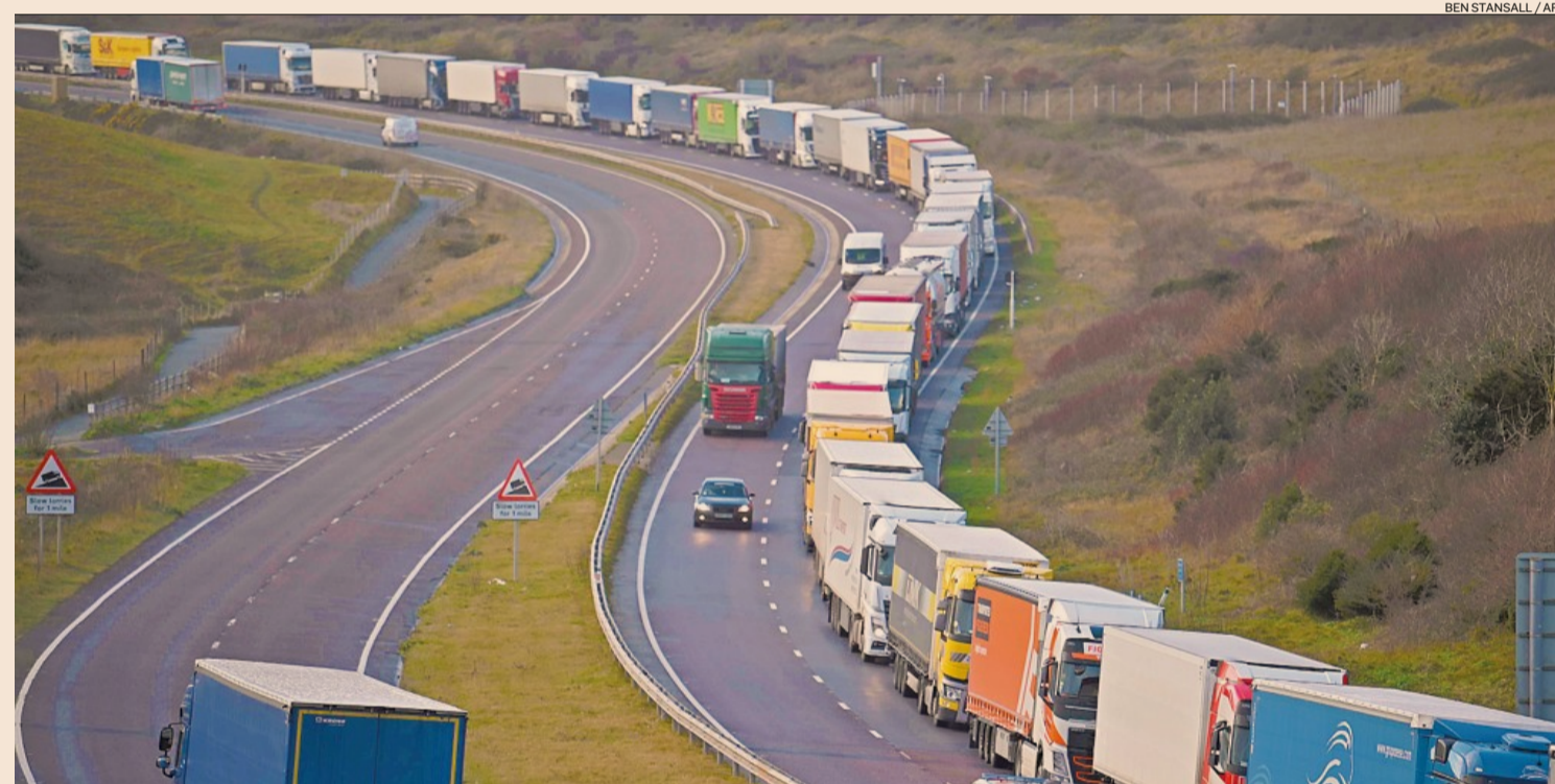
Alle porte dell'Unione. Le lunghe code di Tir in direzione del porto di Dover

Gran Bretagna, confini chiusi La rabbia degli italiani bloccati