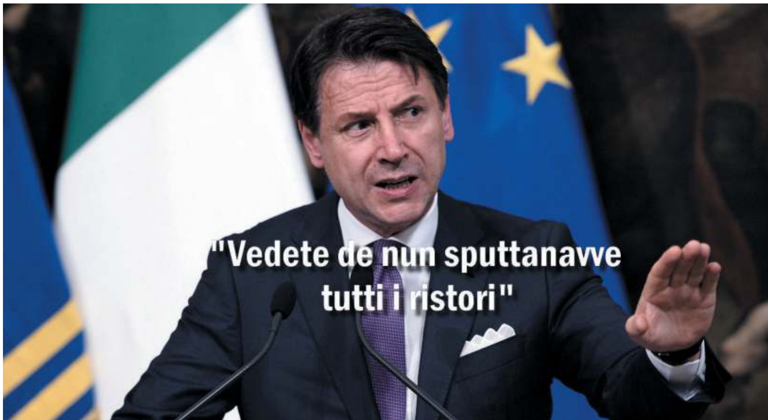
Frasca a pagina 8