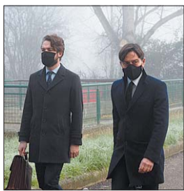
Lo scandalo dei concorsi