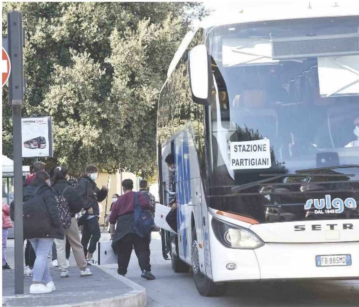
In cantiere un'applicazione per gli studenti che consenta di monitorare gli orari e la linea del bus che utilizzano

È il caso di ribadire infatti che mentre al loro interno le scuole sono state sempre definite come un luogo sicuro, è durante l'arrivo e l'uscita dai plessi che si creano situazioni potenziali di pericolo per il Covid-19. Per questo è stata chiesta una capienza minore dei mezzi di trasporto, per questo verrà applicato un orario di ingresso e uscita sca-