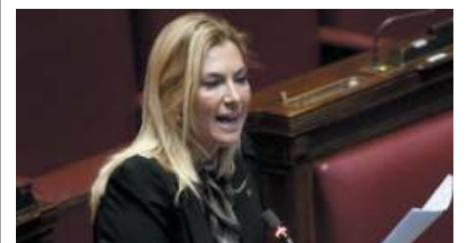
Solimene a pagina 4