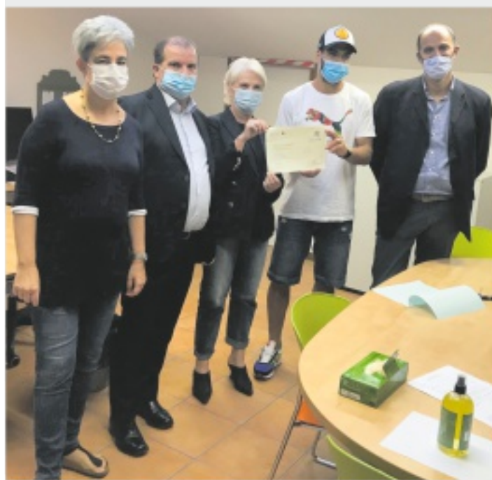
GUAI L'esame di italiano di Luis Suarez (a destra con il berretto)