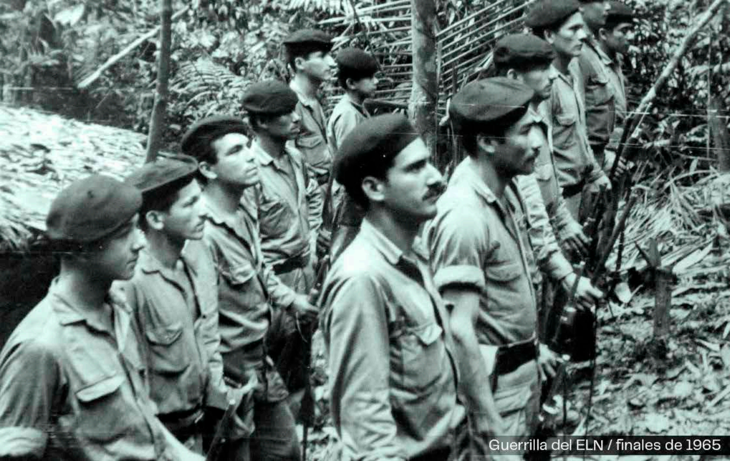
Guerrilla del ELN / finales de 1965

En el mes de septiembre fueron intensos los combates, hubo decenas de compañeros muertos y heridos, pero pocas las capturas, lo que muestra el temple de los guerrilleros.