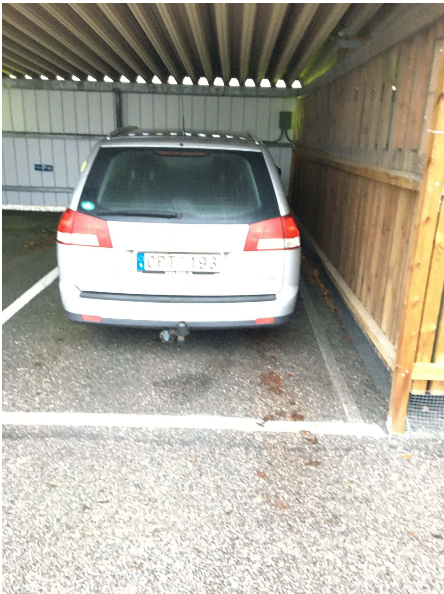
2. Bilder på bilen som den stod när den anträffades av polispatrull. Tillhörande misstänkt Eriksson.