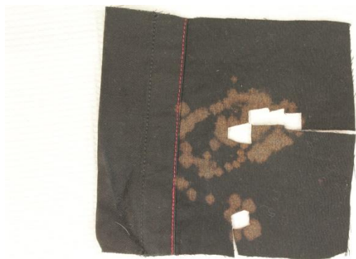
Bild 3. Test med jämförelsematerialet 5201/51973-19/S014 på ”ren” byxdel

En till synes ren del från byxorna (nedre bakben) klipptes bort. Lite klorin från jämförelsematerialet 5201/51973-19/S014 droppades på. Efter en kort stund syntes en blekning i form av en brunaktig nyans, se bild 3.