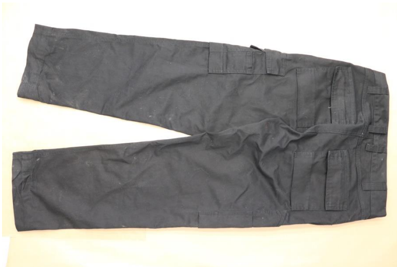
Bild 2. Baksida

Delar av fläckarna klipptes ut och undersöktes avseende pH och kloridjoner. Vid undersökning erhöles ett neutralt pH samt negativt utslag avseende kloridjoner.