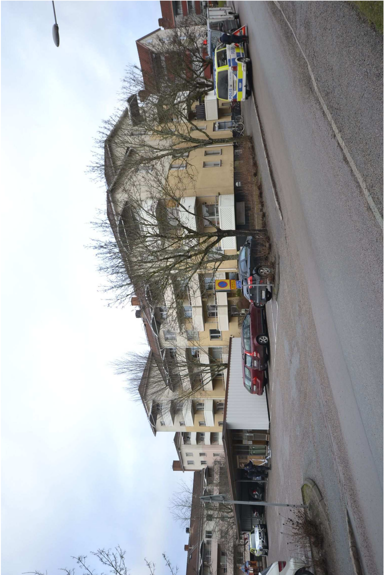
1. Lokusbilder från sophus