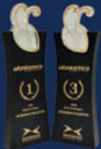
Altın Karınca Belediyecilik Ödülleri 1 birincilik, 1 üçüncülük