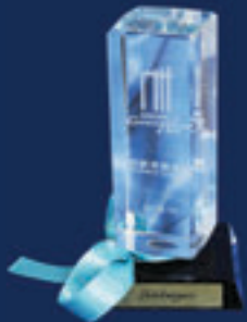
Guangzhou Uluslararası Kentsel İnovasyon Ödülleri Katılım Ödülü