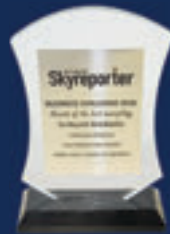
Sky Reporter Dergisi En Başarılı Belediyeler Ödülü