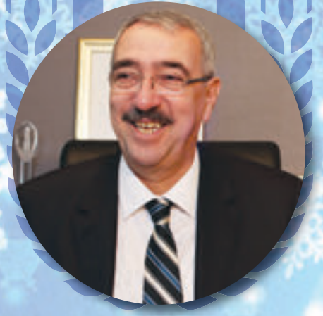
Emin HALEBAK Lüleburgaz Belediye Başkanı

Bu yıl, dünyada ve ülkemizde yaşananlar hepimizi derinden etkilerken, Lüleburgaz'ımız için özel bir yıl olarak tarih sayfaları arasında yerini aldı. Kurumsal kapasitemizin gelişimi, kentsel birikim ve deneyim olarak pek çok yönüyle pozitif gelişmelerle dolu, başarılı bir yıl oldu.