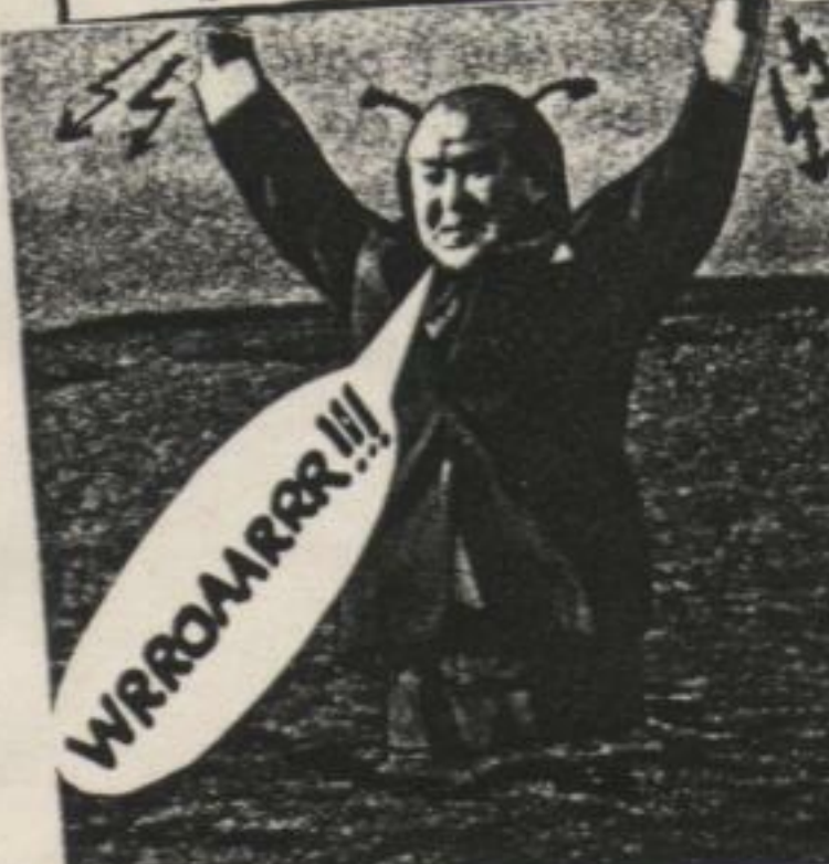
KADR Z NOWEGO JAPONSKIEGO FILMU PT. „POTWÓR Z GŁĘBIN OCEANÓW” (DLA LUDZI O MOCNYCH GŁOWACH)