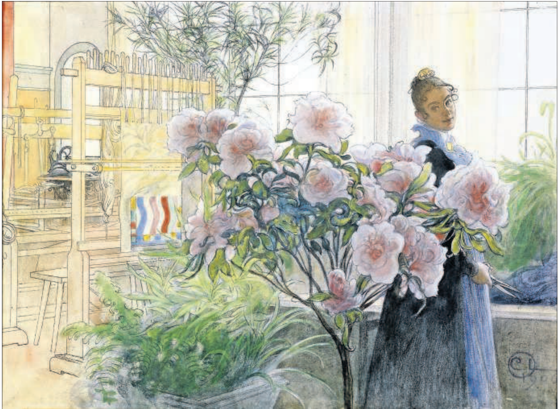
Carl Larsson. Azalea. 1906. Thielska Galleriet Stockholm