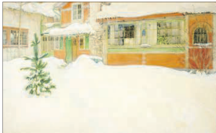
Carl Larsson. Sne; Hytten i sne. 1909. Åbo Konstmuseum

Udstillingen kan ses indtil 8. februar 2015 og ledsages af et både smukt og spændende katalog.