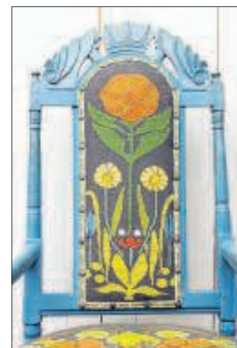
Karin Larsson Stol med vævet ryglæn og betræk, gammel-stuen, 1912.