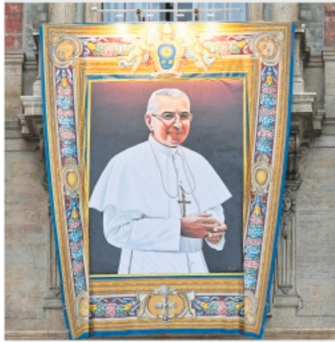
ARAZZO Il dipinto che raffigura Papa Luciani beatificato ieri