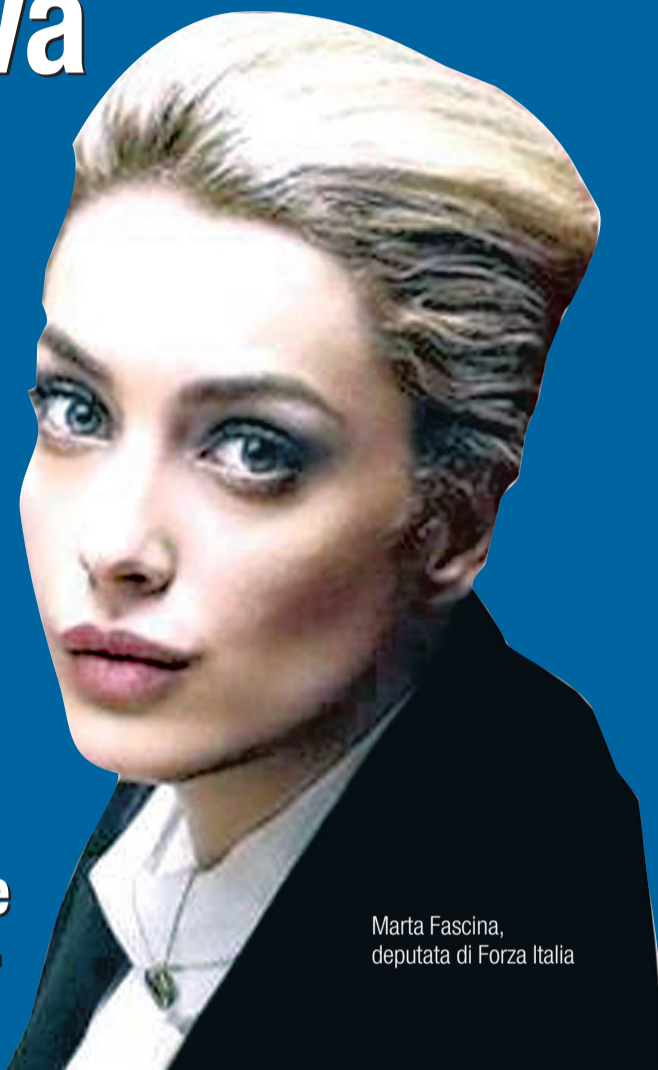
Marta Fascina, deputata di Forza Italia

Marta Fascina: «Mi occupo di Difesa e vi dico che il conflitto si può fermare»