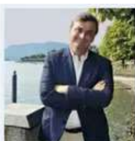
▲ Carlo Calenda ieri a Cernobbio

Al Forum Ambrosetti a Cernobbio Salvini lancia bordate contro le sanzioni alla Russia, e Meloni - seduta accanto a lui - si mette le mani nei capelli. È l'immagine plastica delle divergenze nel centrodestra, a venti giorni dalle elezioni. Il leader leghista è isolato nella posizione filonista rispetto agli altri leader del tavolo - Letta, Tajani, Calenda - e a Conte collegato. In un'intervista a Repubblica Letta chiede a Meloni di «togliere la fiamma dal simbolo del partito».