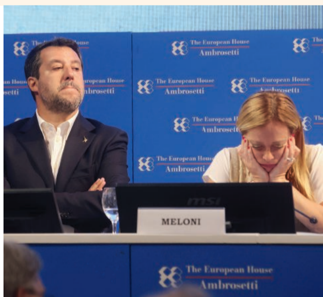
Cernobbio Matteo Salvini e Giorgia Meloni

■ Il 51% degli italiani contro gli embarghi. A Cernobbio, Meloni fa l'americana contro il leghista. Il premier, Letta, Di Maio, Calenda e altri giuravano: "Putin ko in 2 mesi, zero danni per noi"